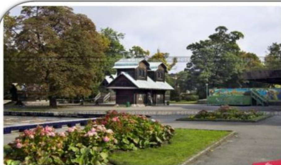
Калининградский зоопарк. Теремок

Один из самых больших и старых зоопарков России. Зоопарк был открыт в 1896 году.