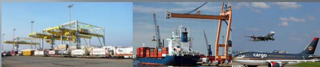
Въезд и временное хранение