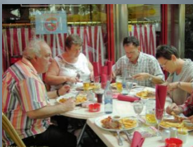
Внутреннее потребление в ЕС