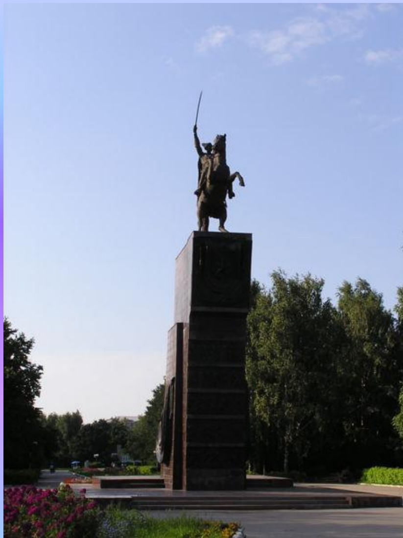
ПАМЯТНИК В. И. ЧАПАЕВУ