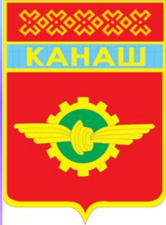
ГЕРБ ГОРОДА КАНАШ