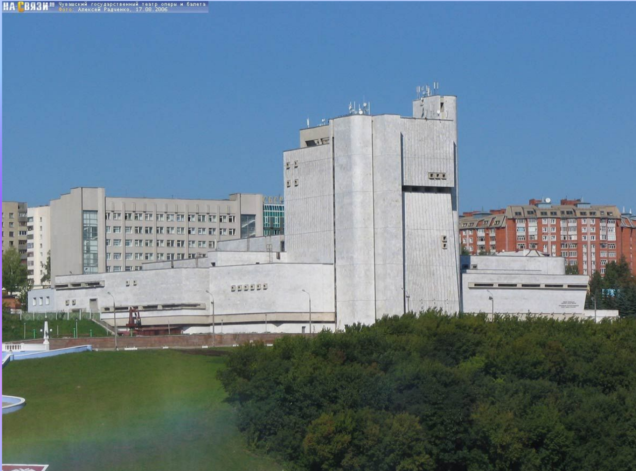
Театр оперы и балета