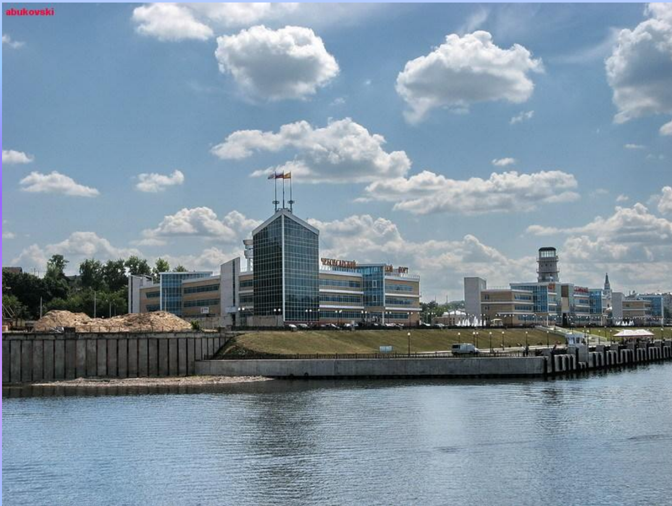
Чебоксарский речной порт