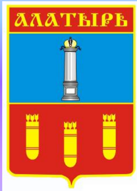
ГЕРБ ГОРОДА АЛАТЫРЬ