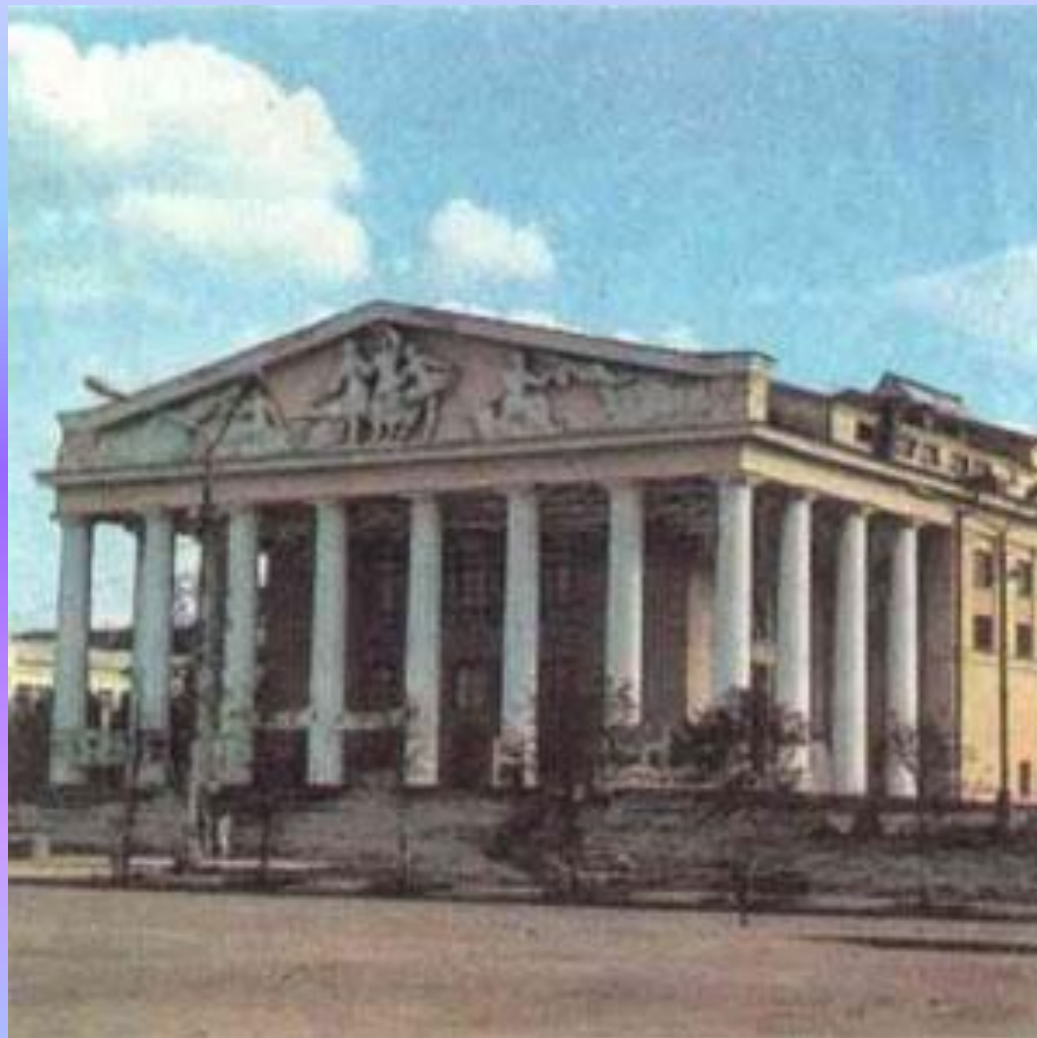
Чувашский драматический театр им. К.Иванова