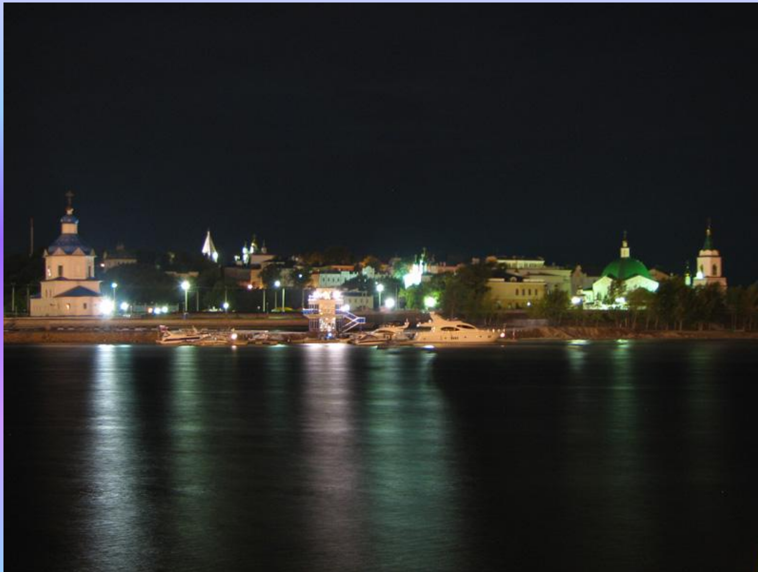
Панорама Чебоксар ночью