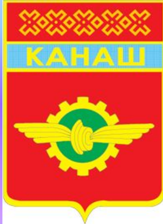
ГЕРБ ГОРОДА КАНАШ