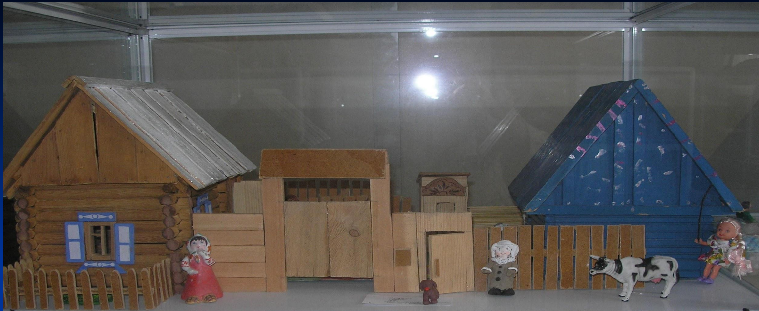
Макет дома бабушки.

Ворота почти не затворяются, щеколда бренчит праздничным набатом – родня прибывает и прибывает. «Бабушкин праздник».