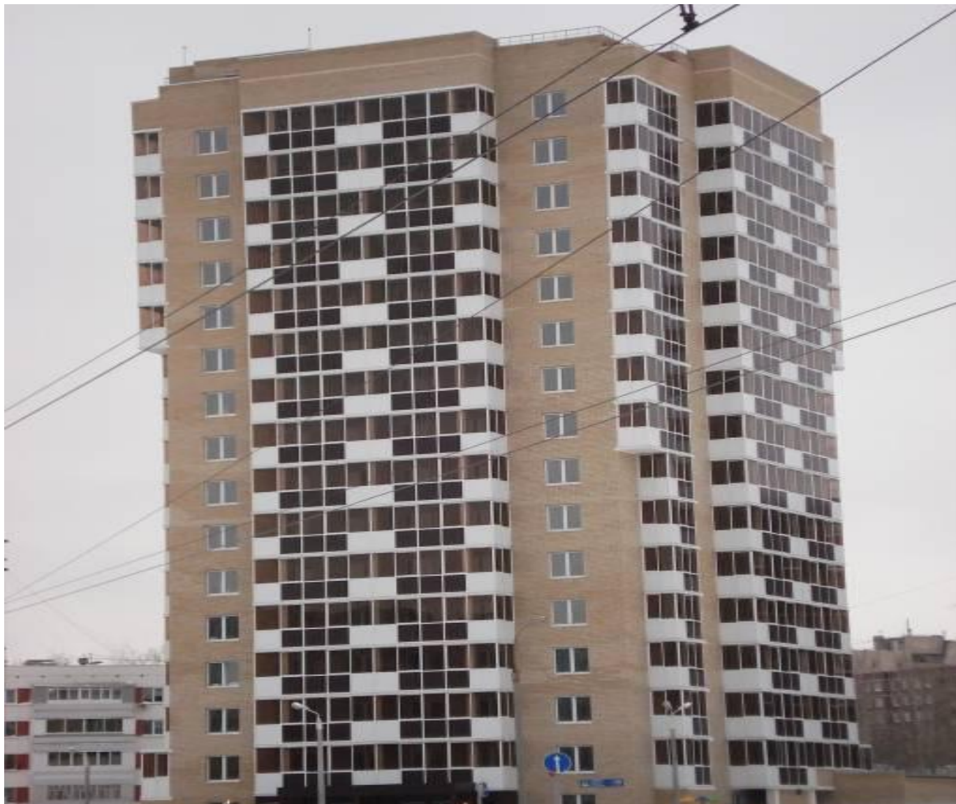
г. Набережные Челны жилой дом 20-01