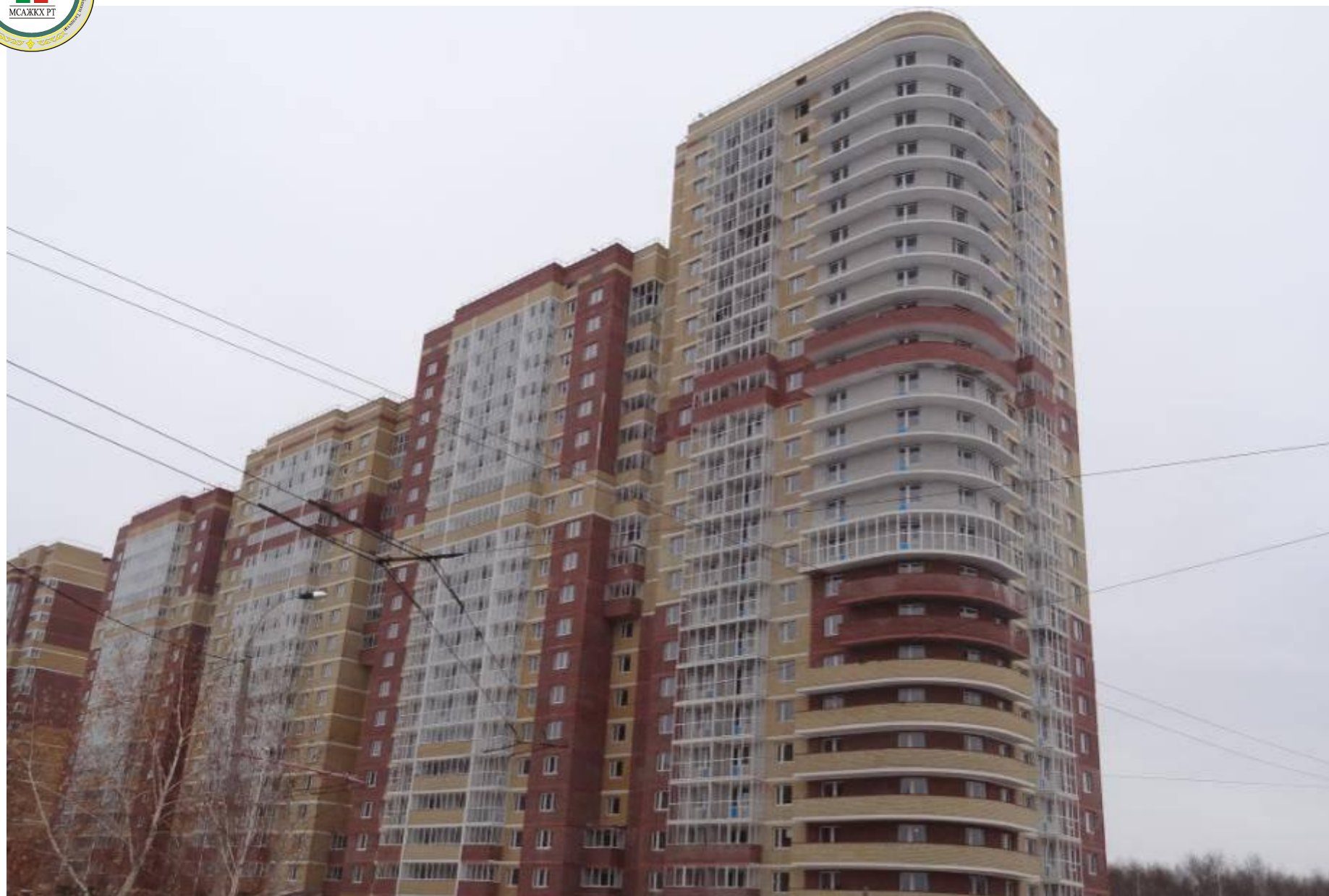
г. Казань, жилой дом 6А-3 в мкр.Азино