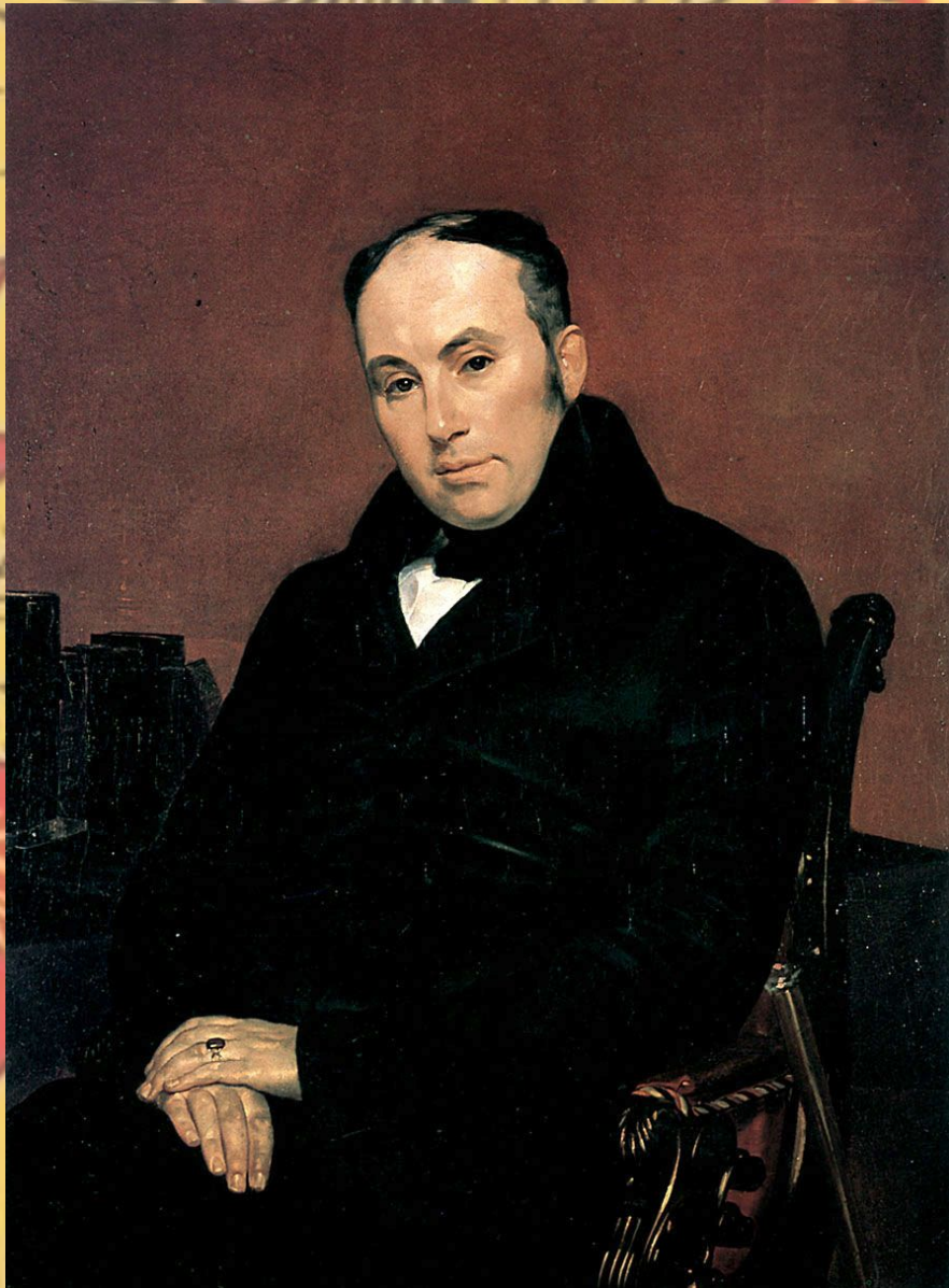
Брюллов Карл. Портрет В.А. Жуковского