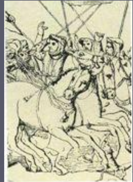
Битва при Иссе. Прорисовки мозаики из Помпей