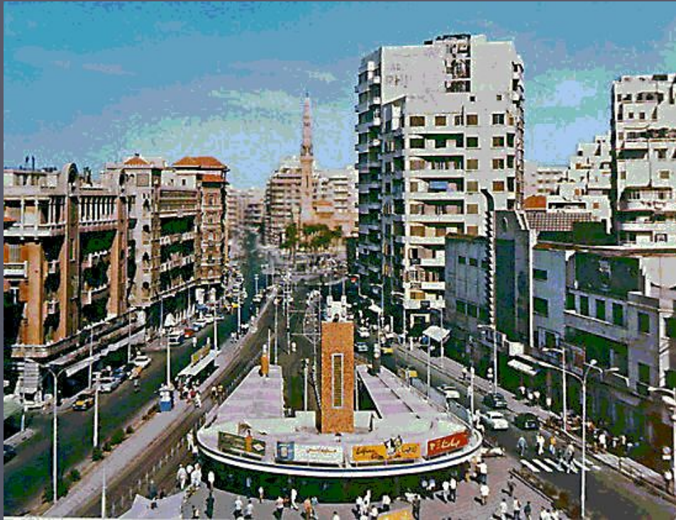
Вид современной Александрии