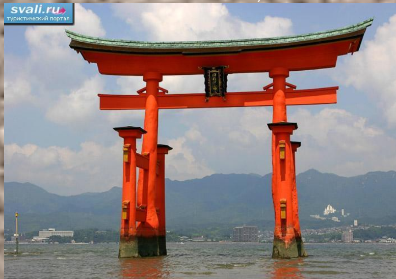
Синтоистская святыня, остров Itsukushima, Япония