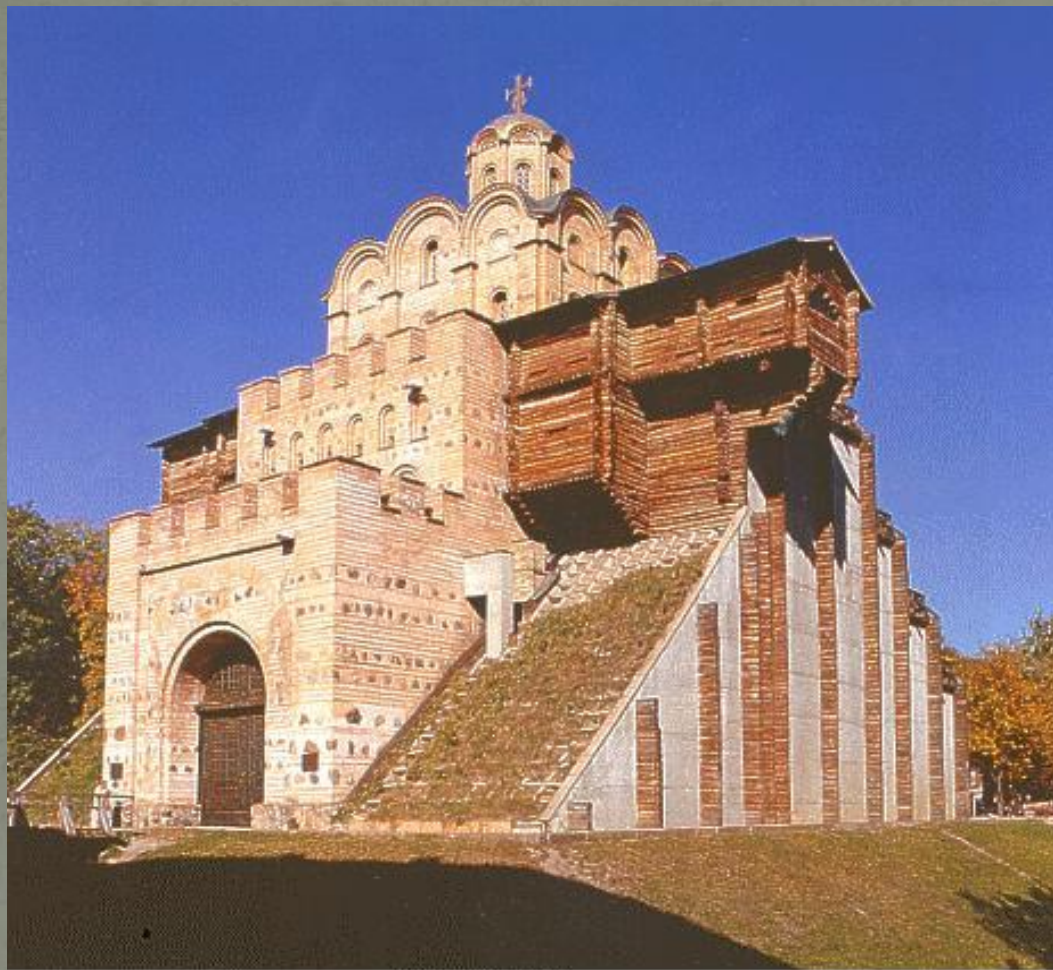
ЗОЛОТІ ВОРОТА. ЗОЛОТЫЕ ВОРОТА. THE GOLDEN GATES.