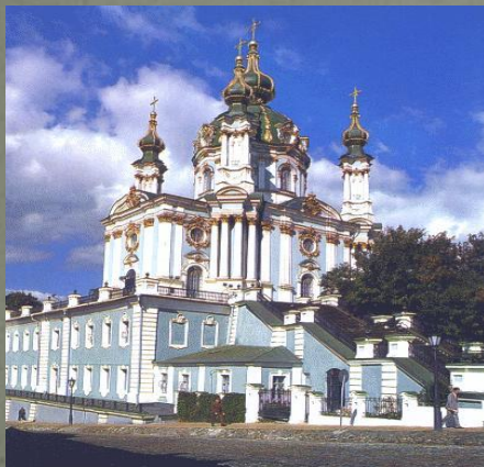
АНДРІЙСЬКА ЦЕРКВА АНДРЕЙСЬКА ЦЕРКОВЬ. ST. ANDREW'S CHURCH.