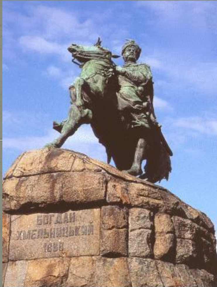
ПАМ'ЯТНИК БОГДАНУ ХМЕЛЬНИЦЬКОМУ. ПАМ'ЯТНИК БОГДАНУ ХМЕЛЬНИЦЬКОМУ. MONUMENT TO BOGDAN KHMELNYTSKY .