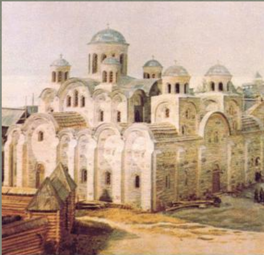
ДЕСЯТИННА ЦЕРКВА. РЕКОНСТРУКЦІЯ. ДЕСЯТИННАЯ ЦЕРКОВЬ. РЕКОНСТРУКЦИЯ. THE TITHE CHURCH. RECONSTRUCTION.