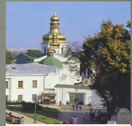
34. БАБИЖІ ПЕЧЕРИ. БАБИЖІ ПЕЩЕРИ. NEAR CAVES.