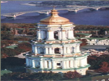
17. ВЕЛИКА ДЗВОННИЦЯ. БОМБЕВИ КОЛОКОЛНИЦЯ. GREAT BELL TOWER.