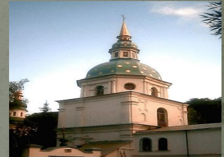
3. ДЗВОННИЦЯ КОЛОКОЛНИЦЯ. BELL TOWER.