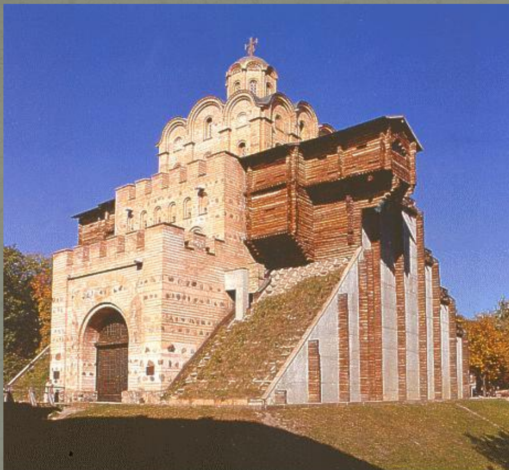
ЗОЛОТІ ВОРОТА. ЗОЛОТЫЕ ВОРОТА. THE GOLDEN GATES.