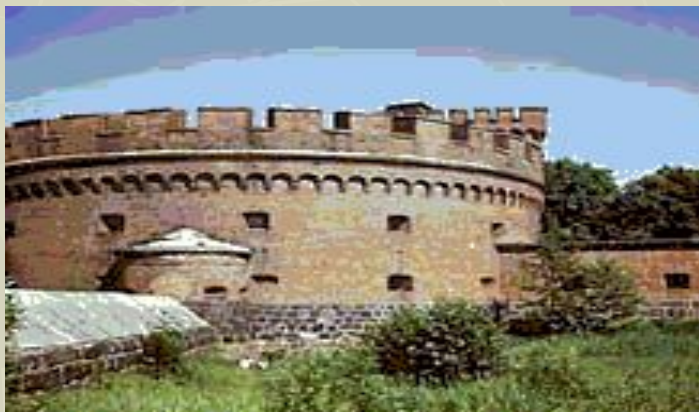
Калининград. Башня Дона