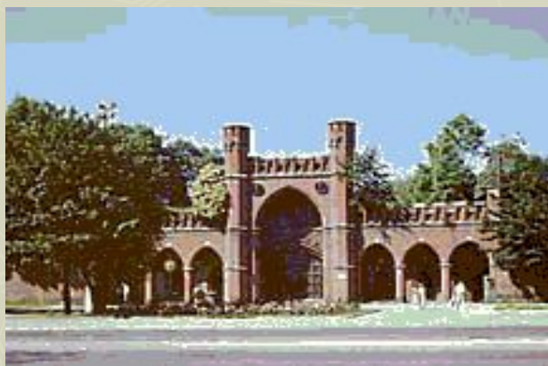
Калининград. Росгартенские ворота