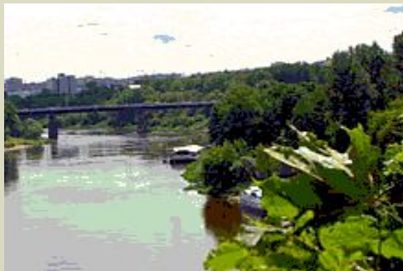
Вид на Неман