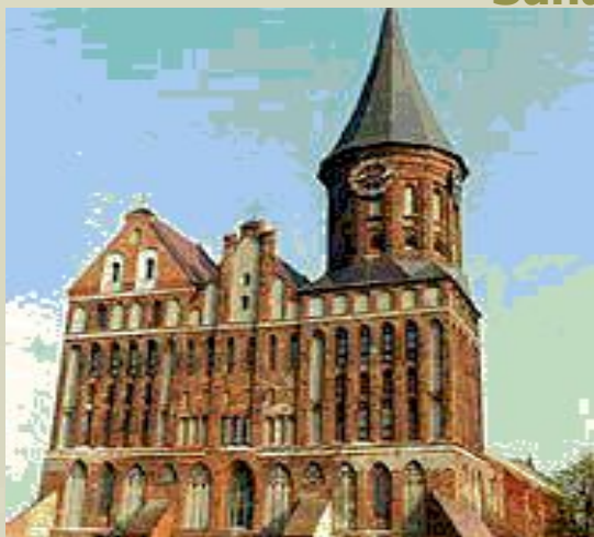
Кафедральный собор Кенигсберга

КАЛИНИНГРАДСКАЯ ОБЛАСТЬ , в Российской Федерации, полуанклав у границы с Польшей и Литвой. Площадь 15,1 тыс. кв.км. Население 949,6 тыс человек (2004), городское около 80%. 22 города и 5 поселков городского типа. Центр — Калининград. Другие крупные города: Черняховск, Балтийск, Гусев, Советск. Область образована 7 апреля 1946. Входит в состав Северо-Западного федерального округа