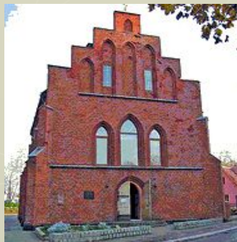
Балтийск( Пиллау). Кафедральный Георгиевский морской Собор Балтийского флота