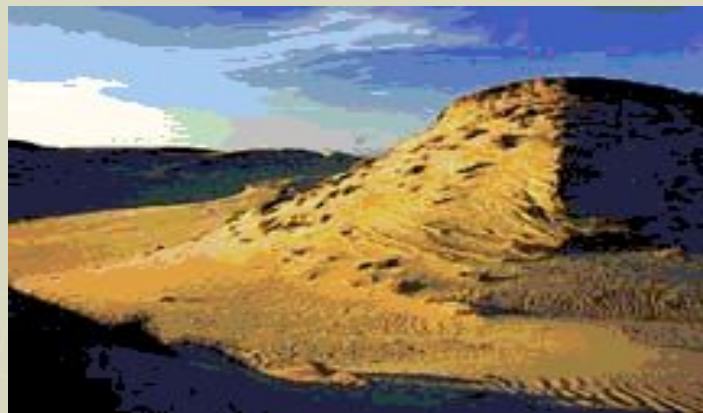
Дюна Куршской косы