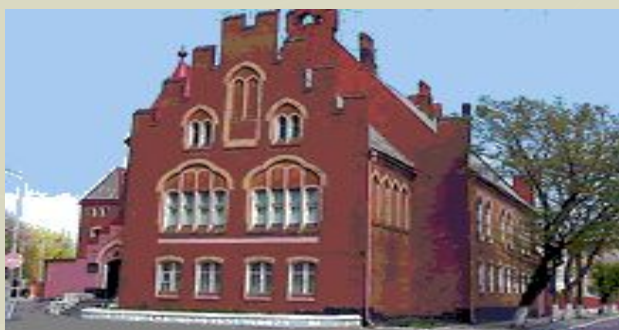
Балтийск. Музей Балтийского флота