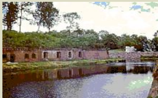
Калининград. Пятый форт