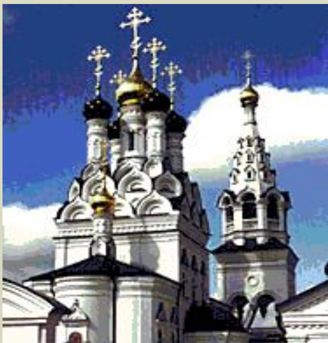
Багратионовск (Прейсиш-Эйлау) Православный храм Свв. Веры, Надежды, Любви и матери их Софьи