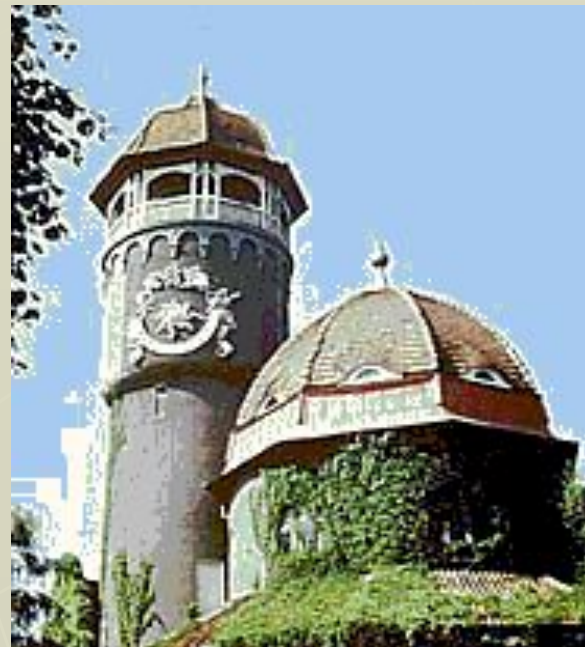
Светлогорск. Башня Грязелечебницы.