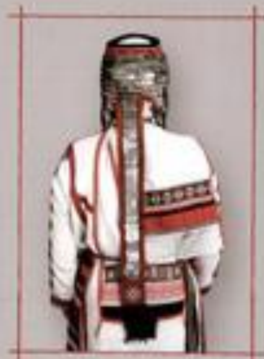
Көпшілік қызығары ұяғары 14-16