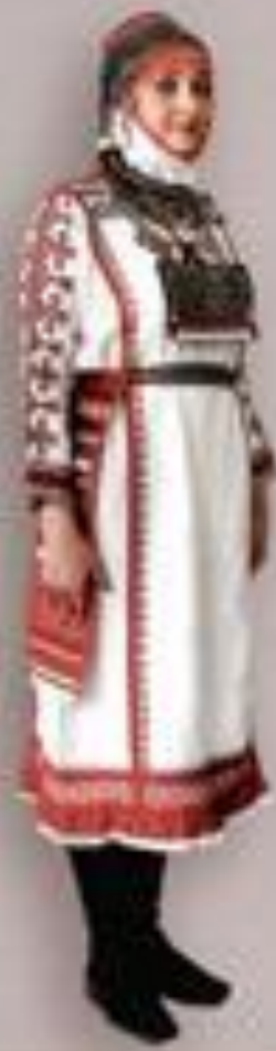
Көпшілік қызығары ұяғары 14-16