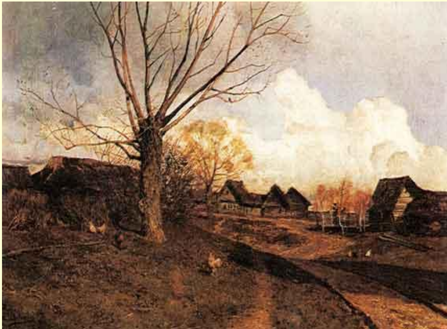
И. Левитан. Саввинская слобода под Звенигородом.