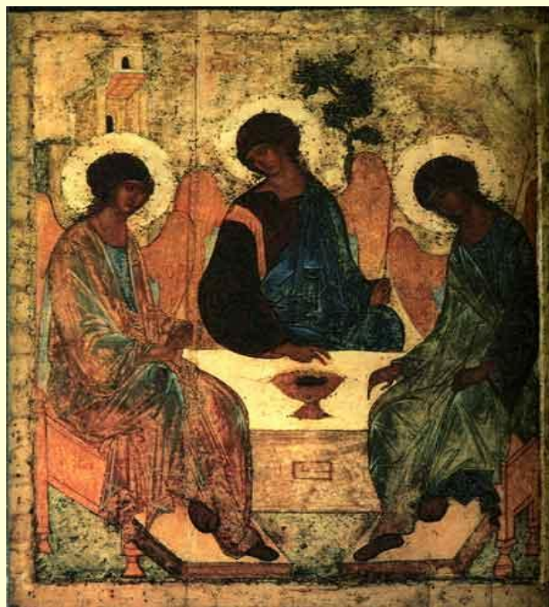
А. Рублёв. Святая Троица.

Известные художники: Леонардо да Винчи, А. Рублёв.