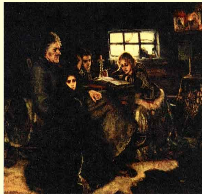
В. Суриков. Меньшиков в Берёзовке