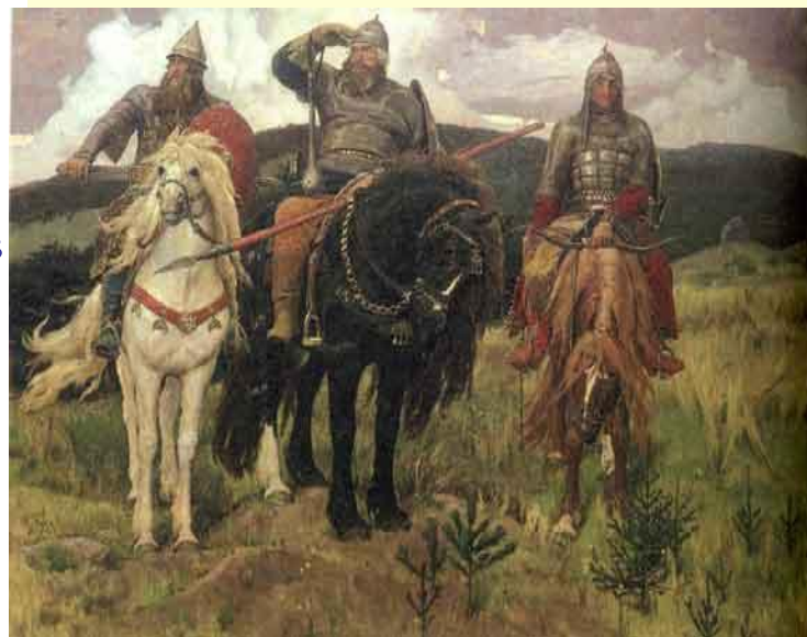
Васнецов. Три богатыря.