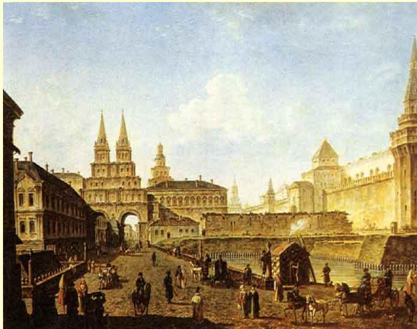
Ф. Алексеев. Вид на Воскресенские и Никольские ворота и Неглинный мост от Тверской улицы.