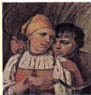
А. Венецианов. Жнецы

Он изображает разные стороны жизни человека: труд и отдых, праздники и будни, забавы и серьезные занятия.