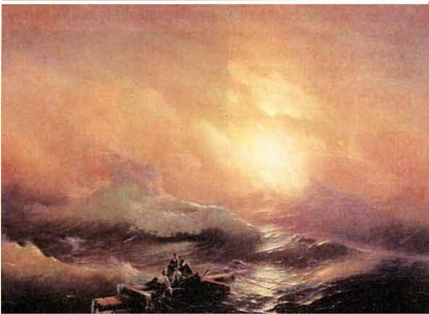
И. Айвазовский. Девятый вал.