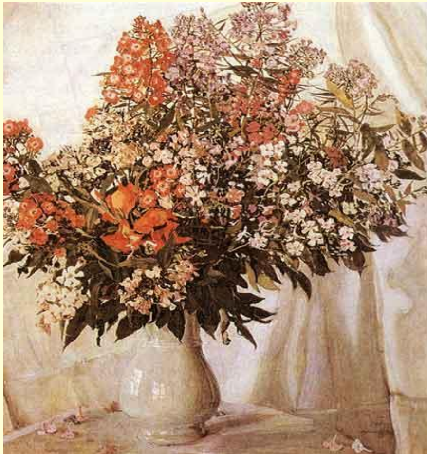
А.Головин. Натюрморт. Цветы в вазе.