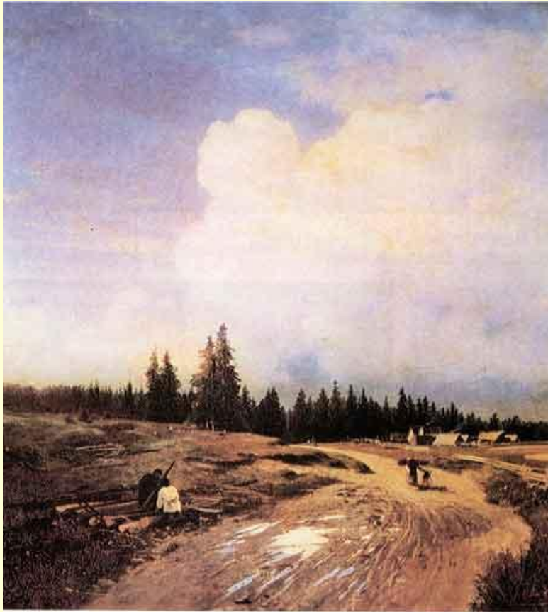
Ф. Васильев. После грозы.