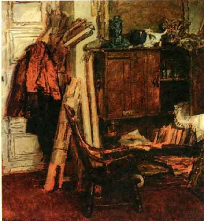
Ф. Решетников. Уголок мастерской.