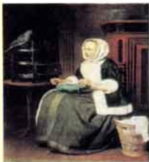
Г. Метсю. Девушка за работой.