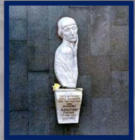
Одесса. Мемориальная доска Ахматовой

Я родилась 11 (23) июня 1889 года под Одессой (Большой Фонтан). Мой отец был в то время отставной инженер-механик флота. Годовалым ребенком я была перевезена на север - в Царское Село. Там я прожила до шестнадцати лет.