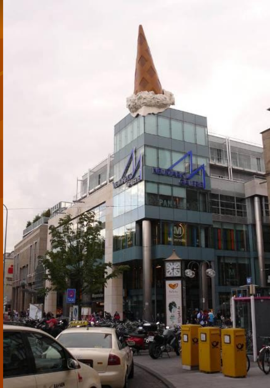
в городе "Ольденбург"