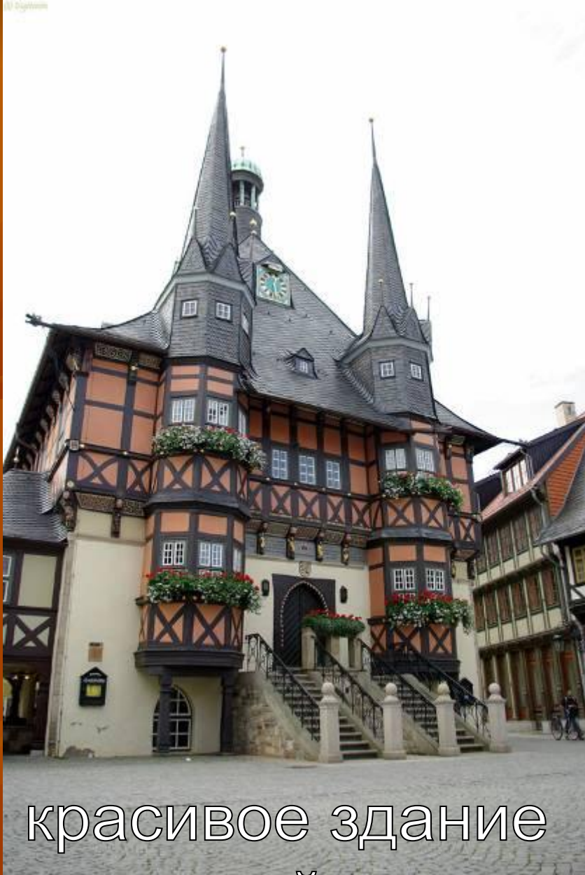
красивое здание на одной из улиц Германии