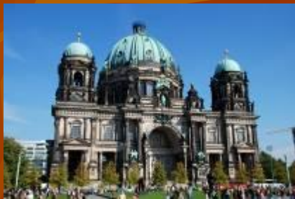
в городе "Берлин"