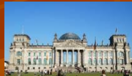
в городе "Берлин"