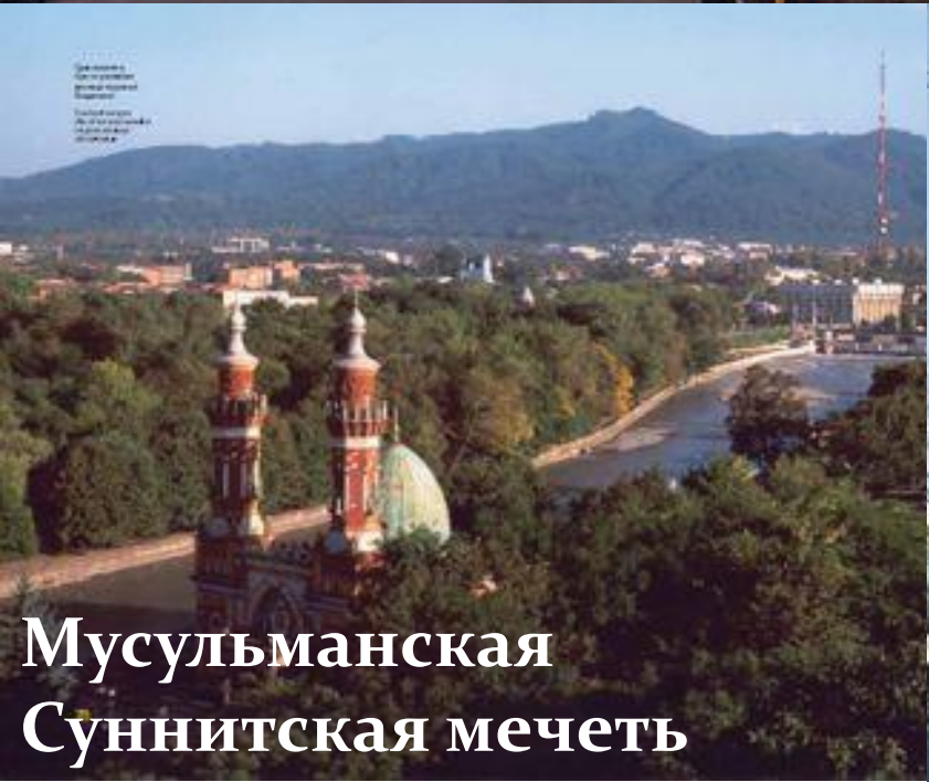
Мусульманская Суннитская мечеть