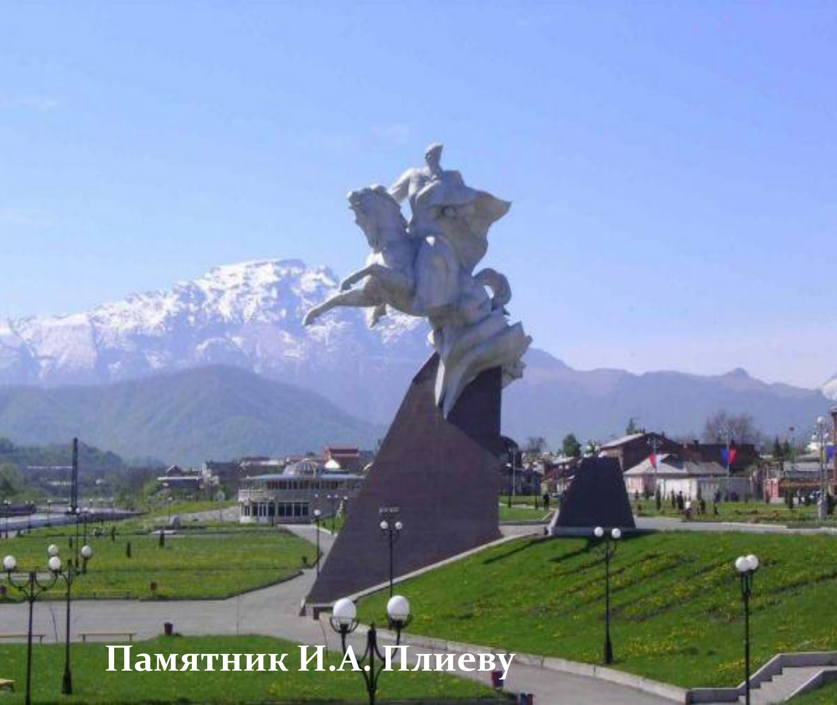
Памятник И.А. Плиеву