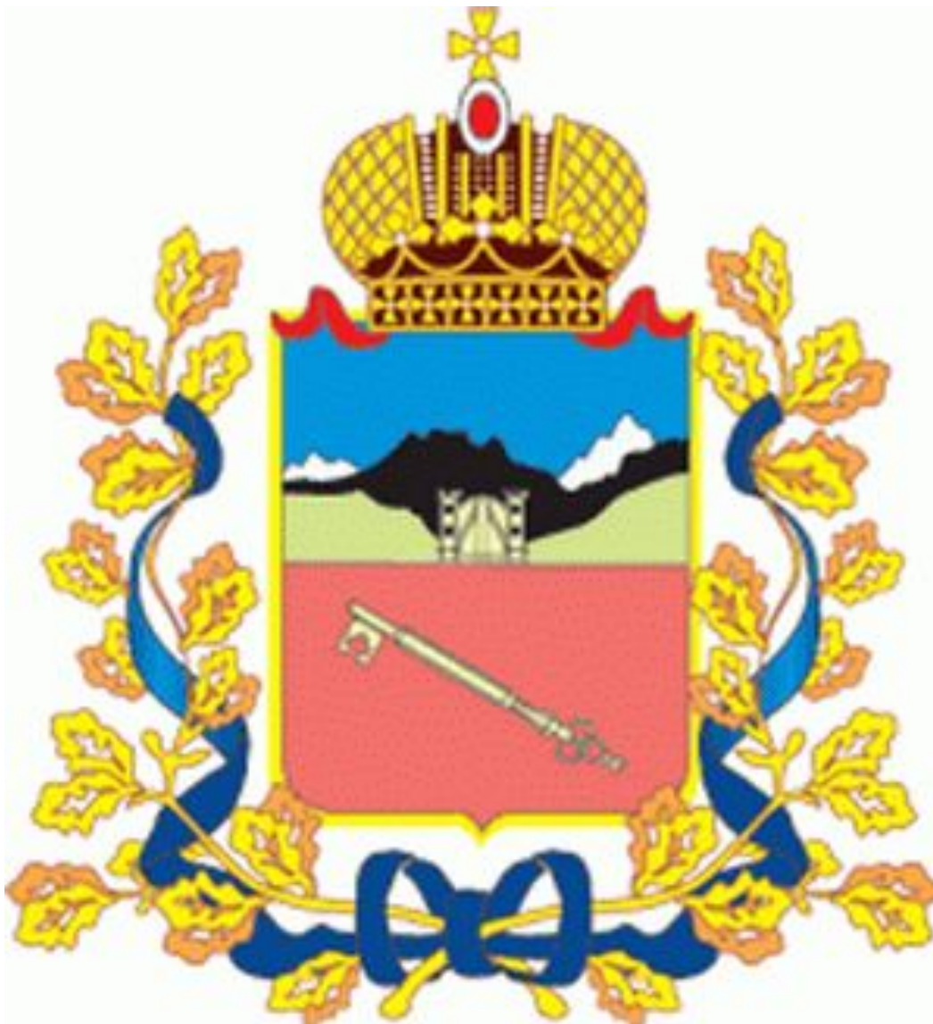
Герб города Владикавказа