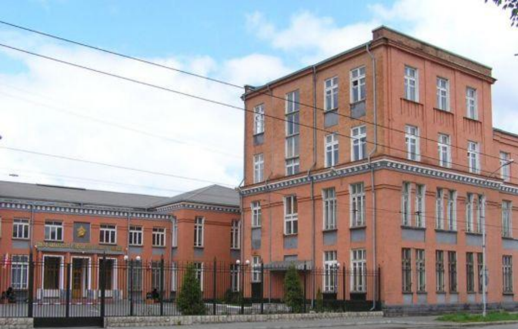
Северо-Кавказское суворовское училище