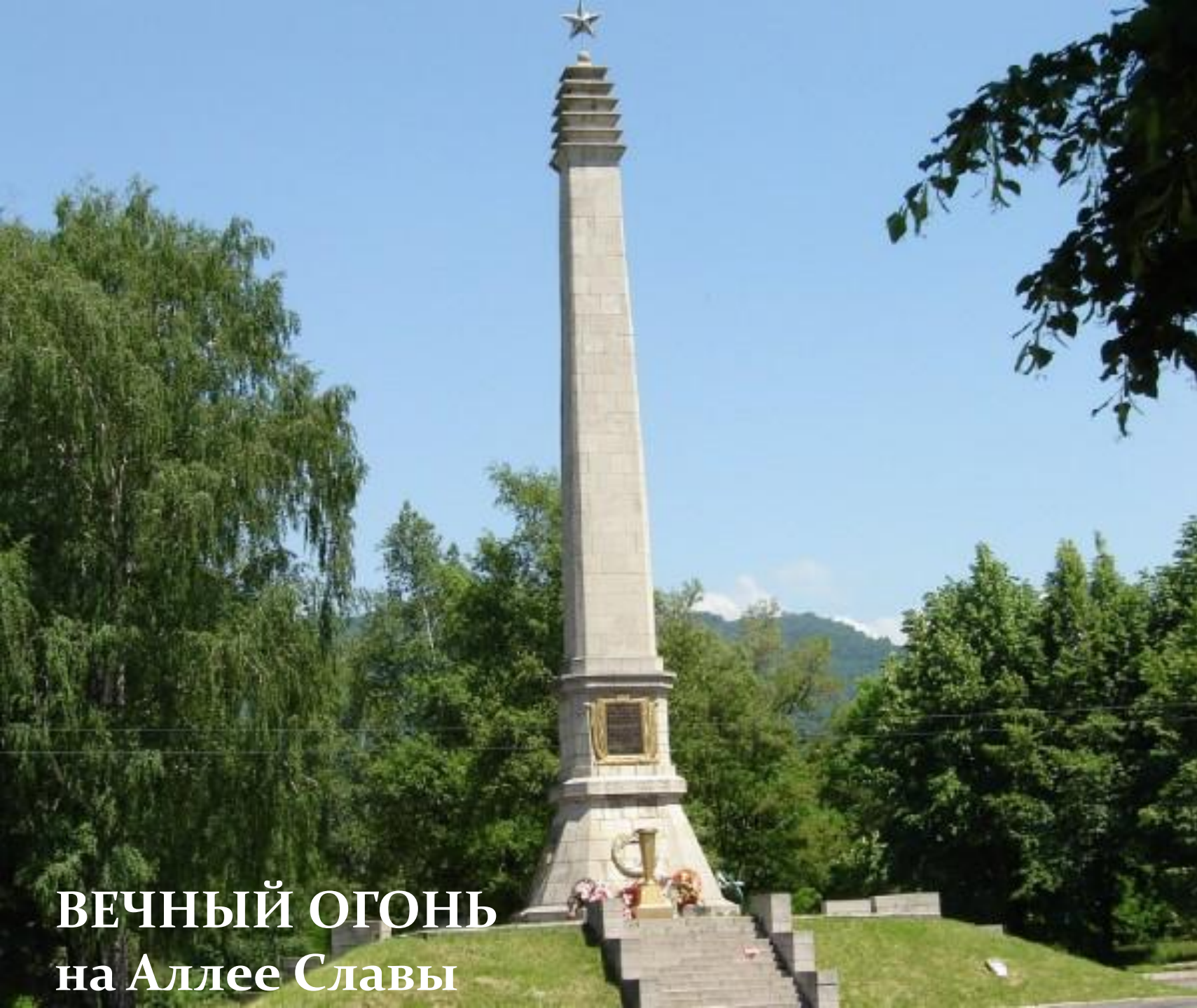
ВЕЧНЫЙ ОГОНЬ на Аллее Славы