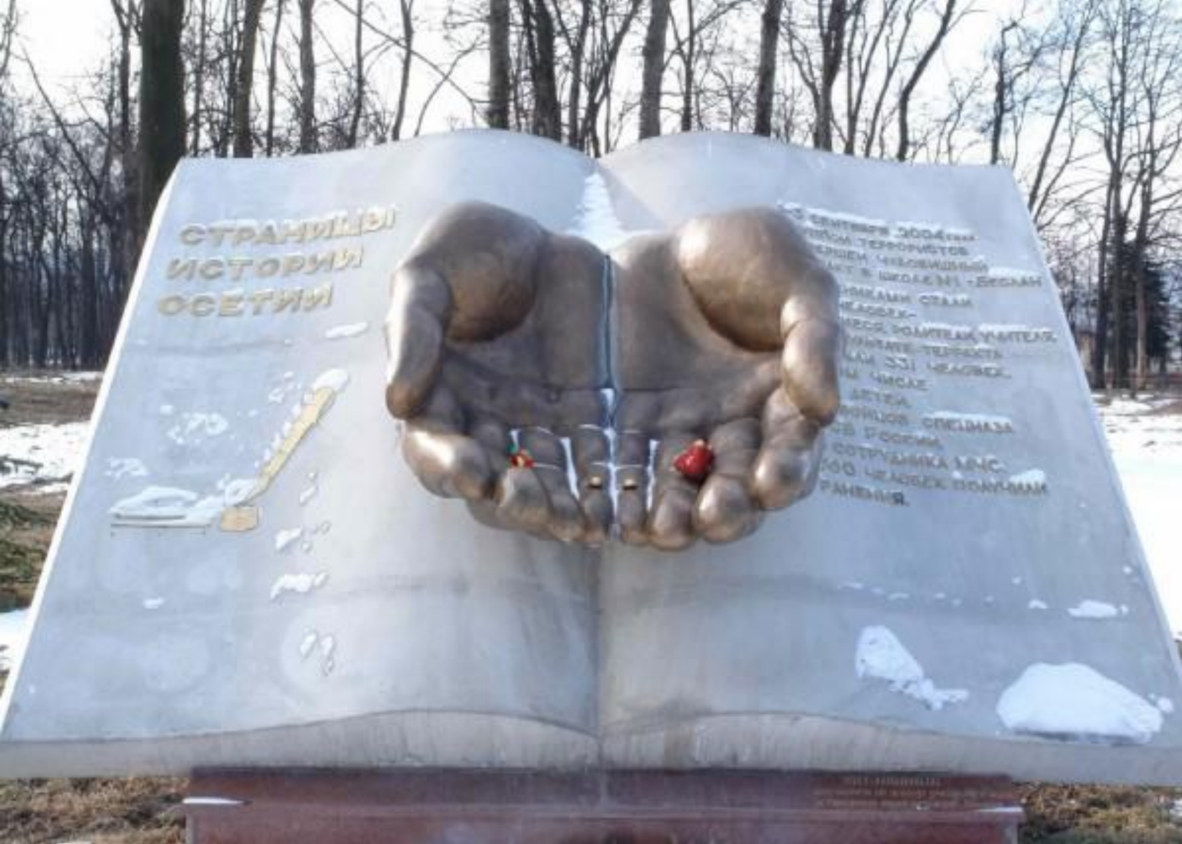
Памятник жертвам бесланской трагедии на Мемориале Славы