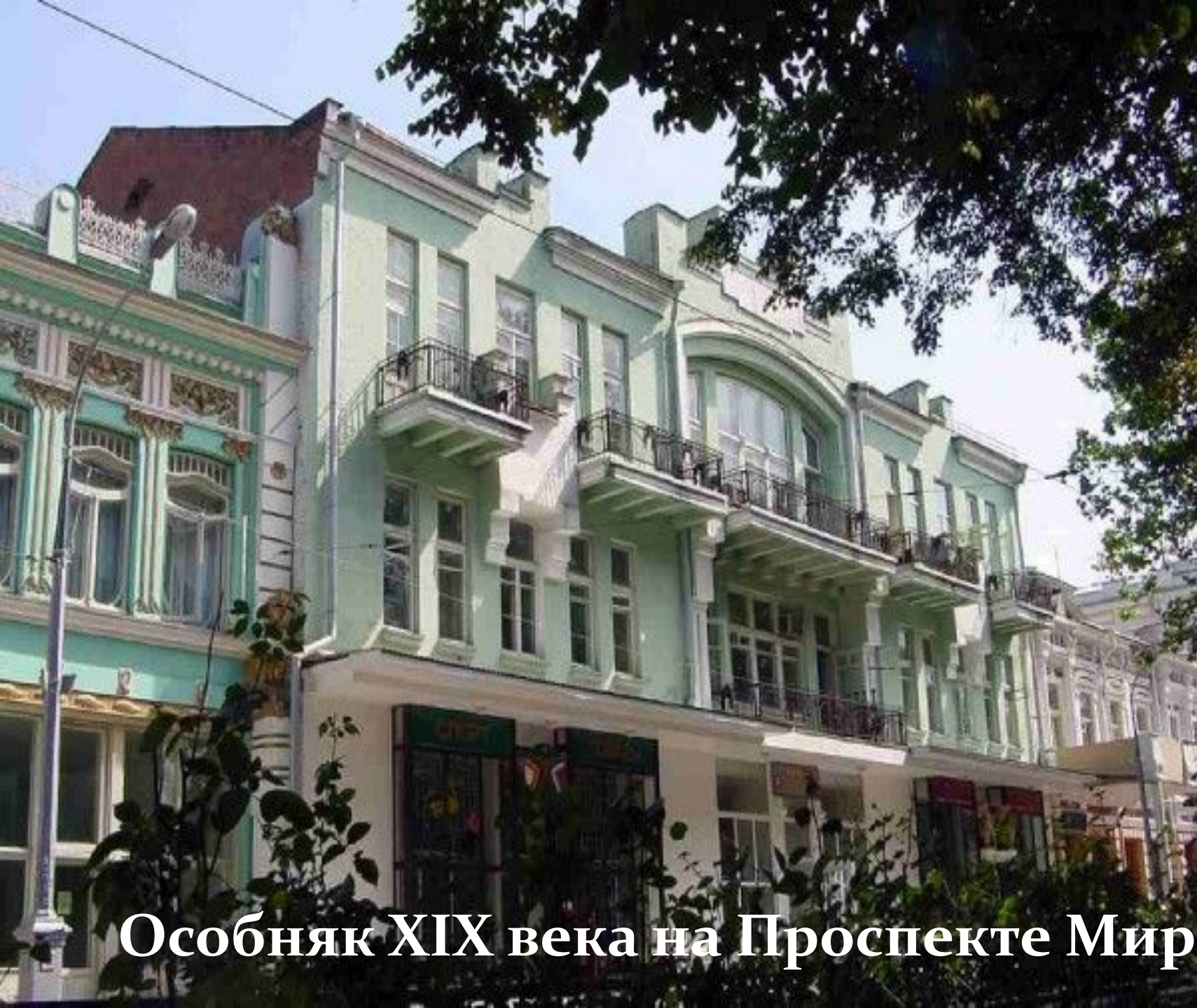
Особняк XIX века на Проспекте Мира