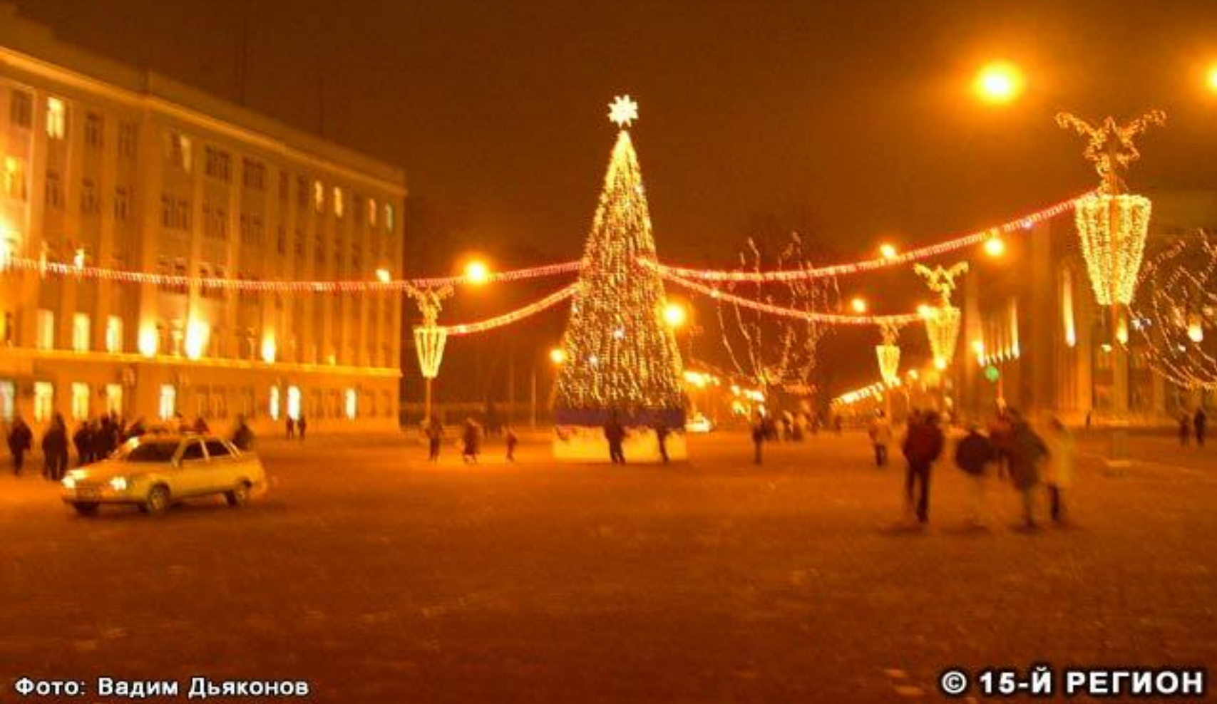
Фото: Вадим Дьяконов