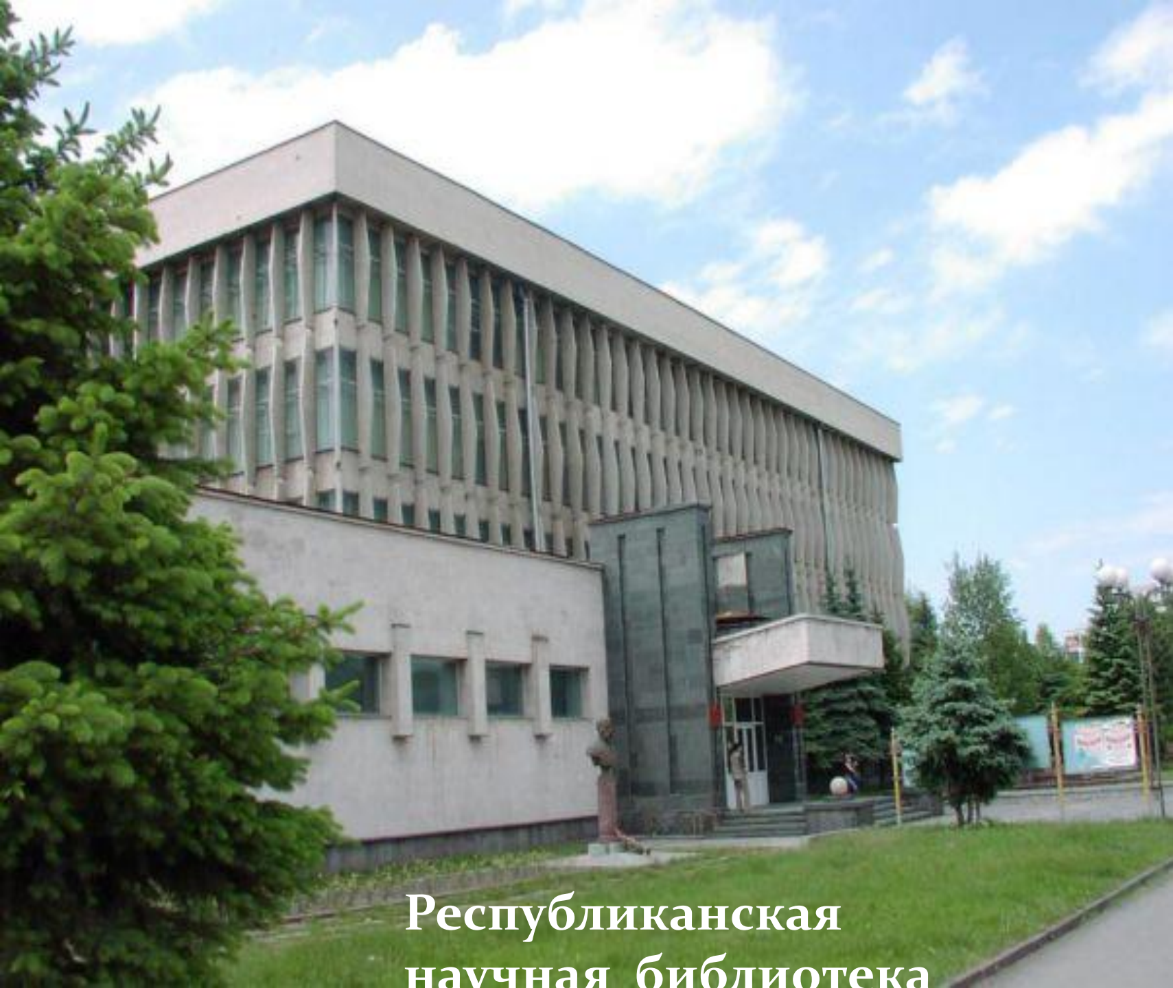
Республиканская научная библиотека