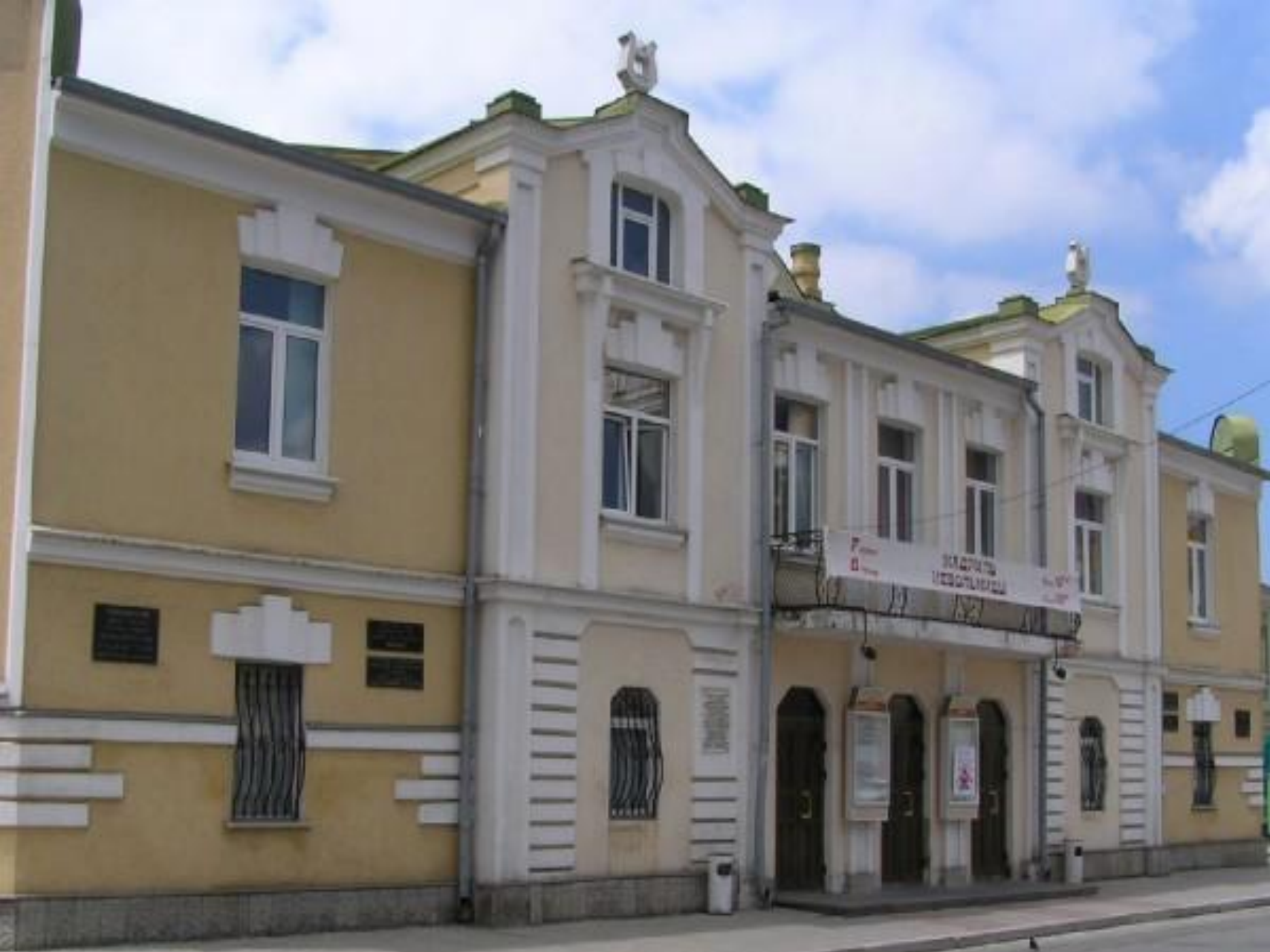
Русский Драматический театр им. Е. Вахтангова