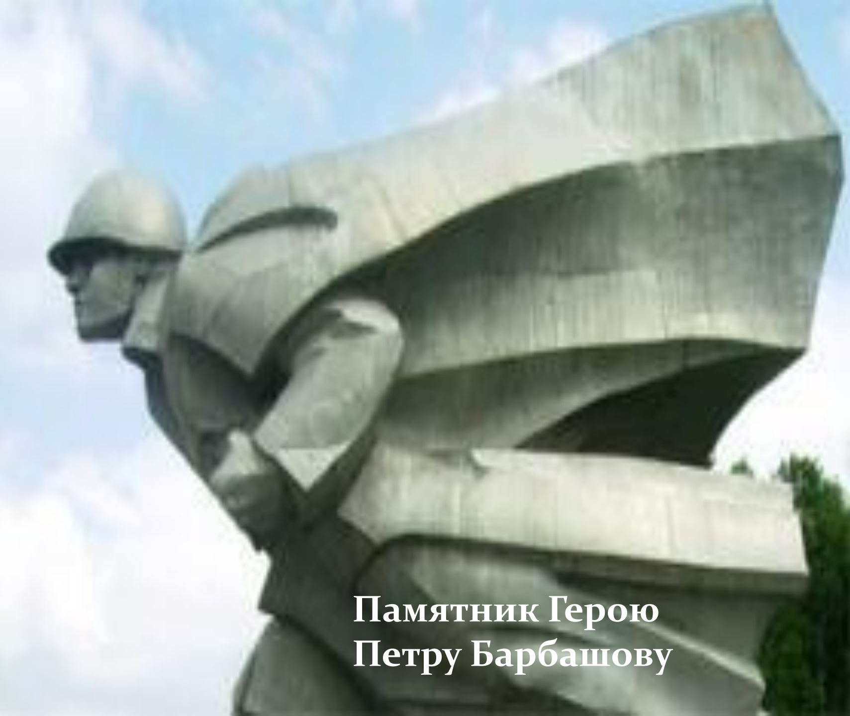
Памятник Герою Петру Барбашову