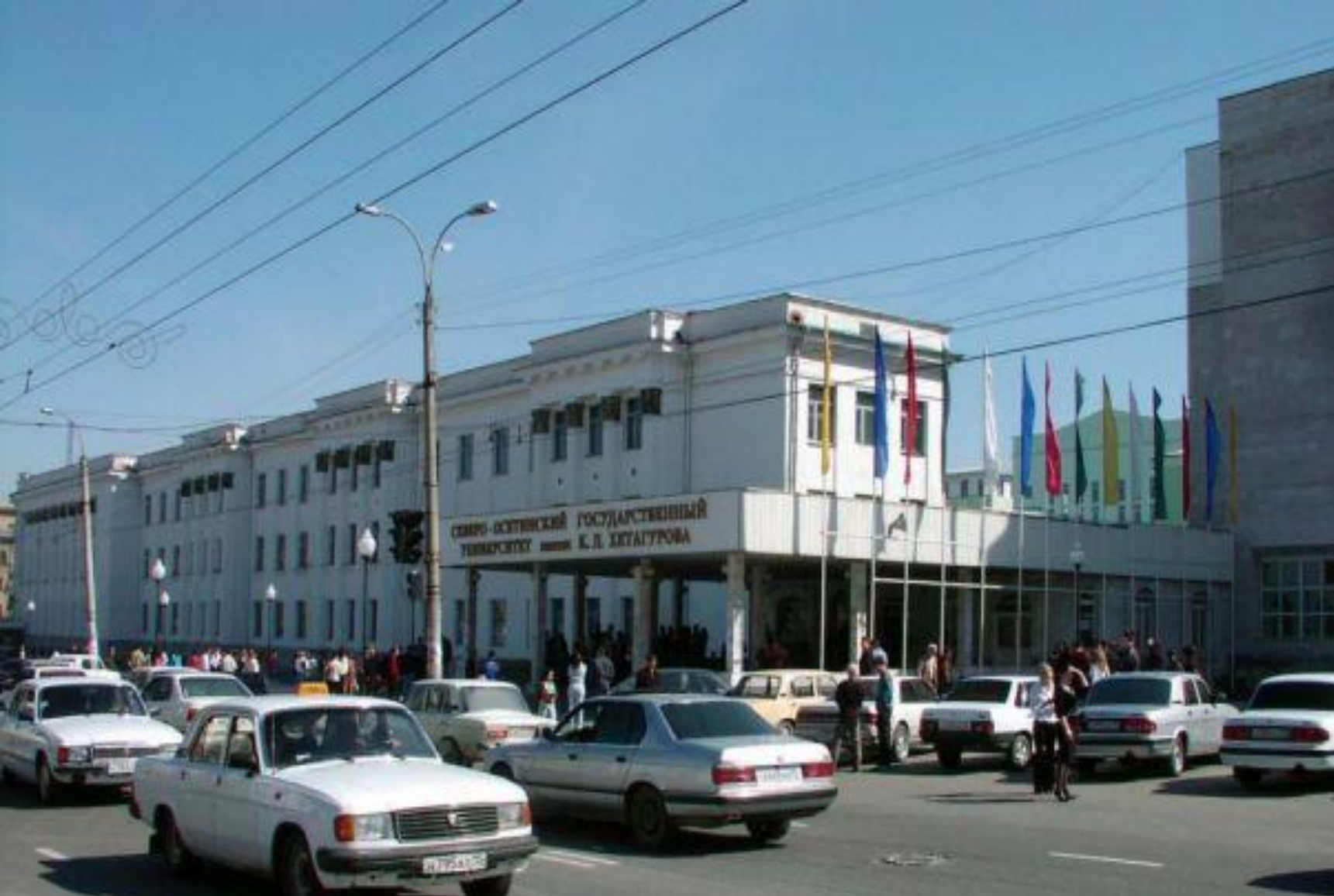
Северо-Осетинский Государственный Университет имени К.Л. Хетагурова