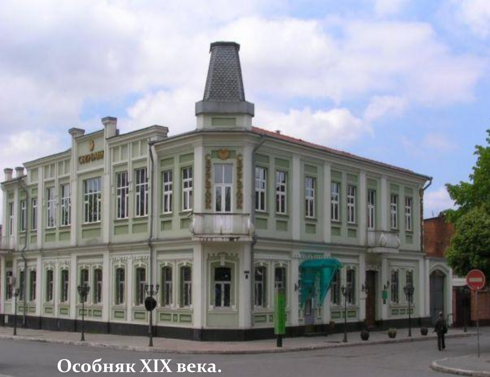
Особняк XIX века. Ныне Государственный Сберегательный Банк