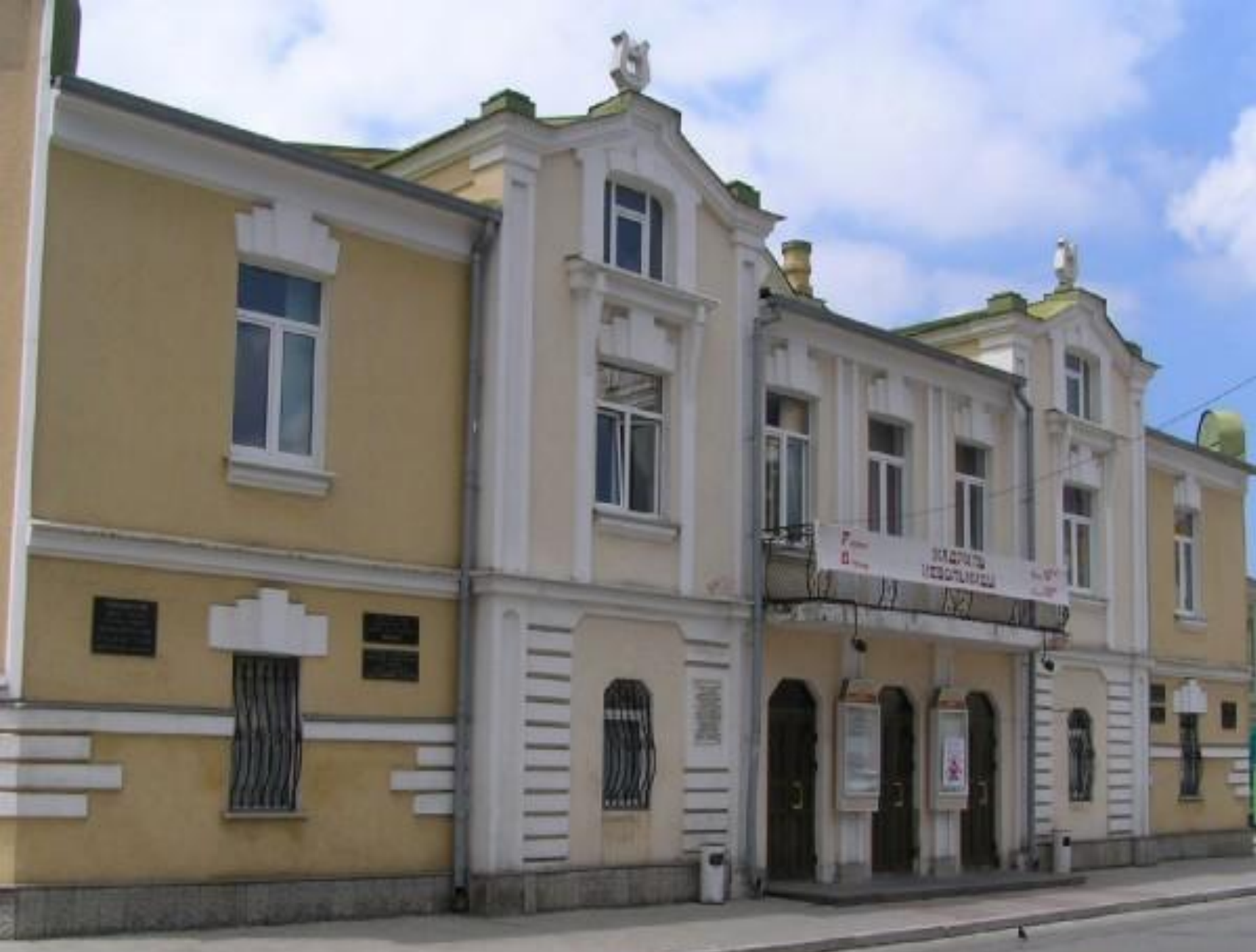
Русский Драматический театр им. Е. Вахтангова