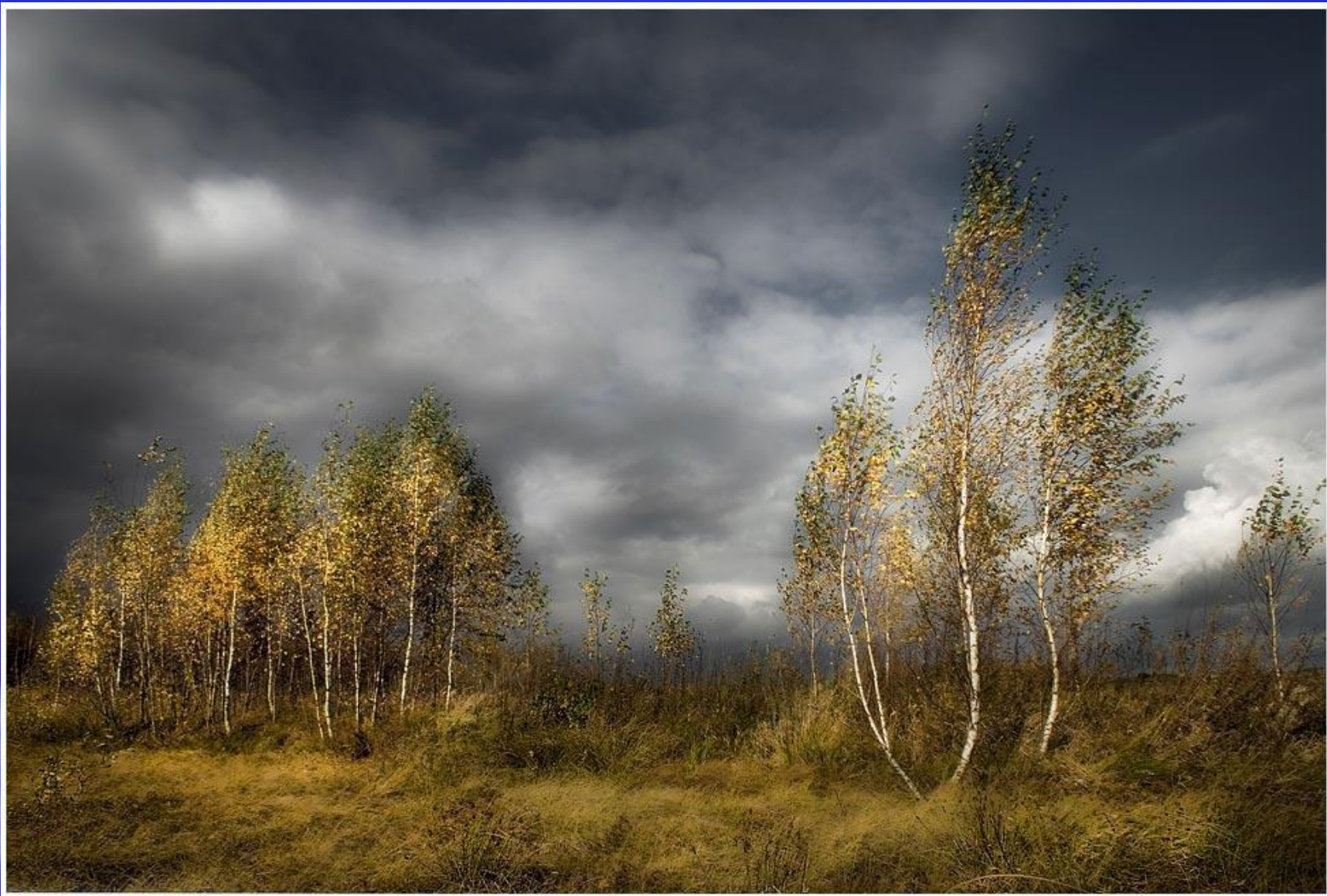
С. В. Рахманинов «Концерт № 2 для фортепиано с оркестром»