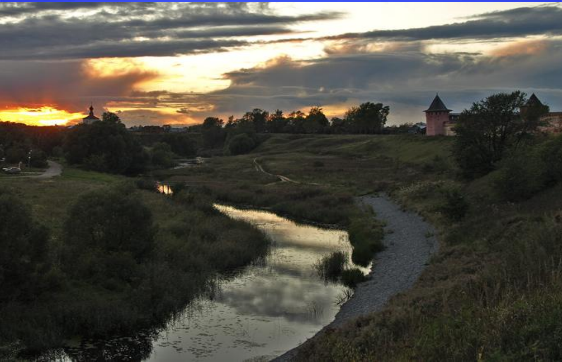
М. П. Мусоргский «Рассвет на Москве-реке»