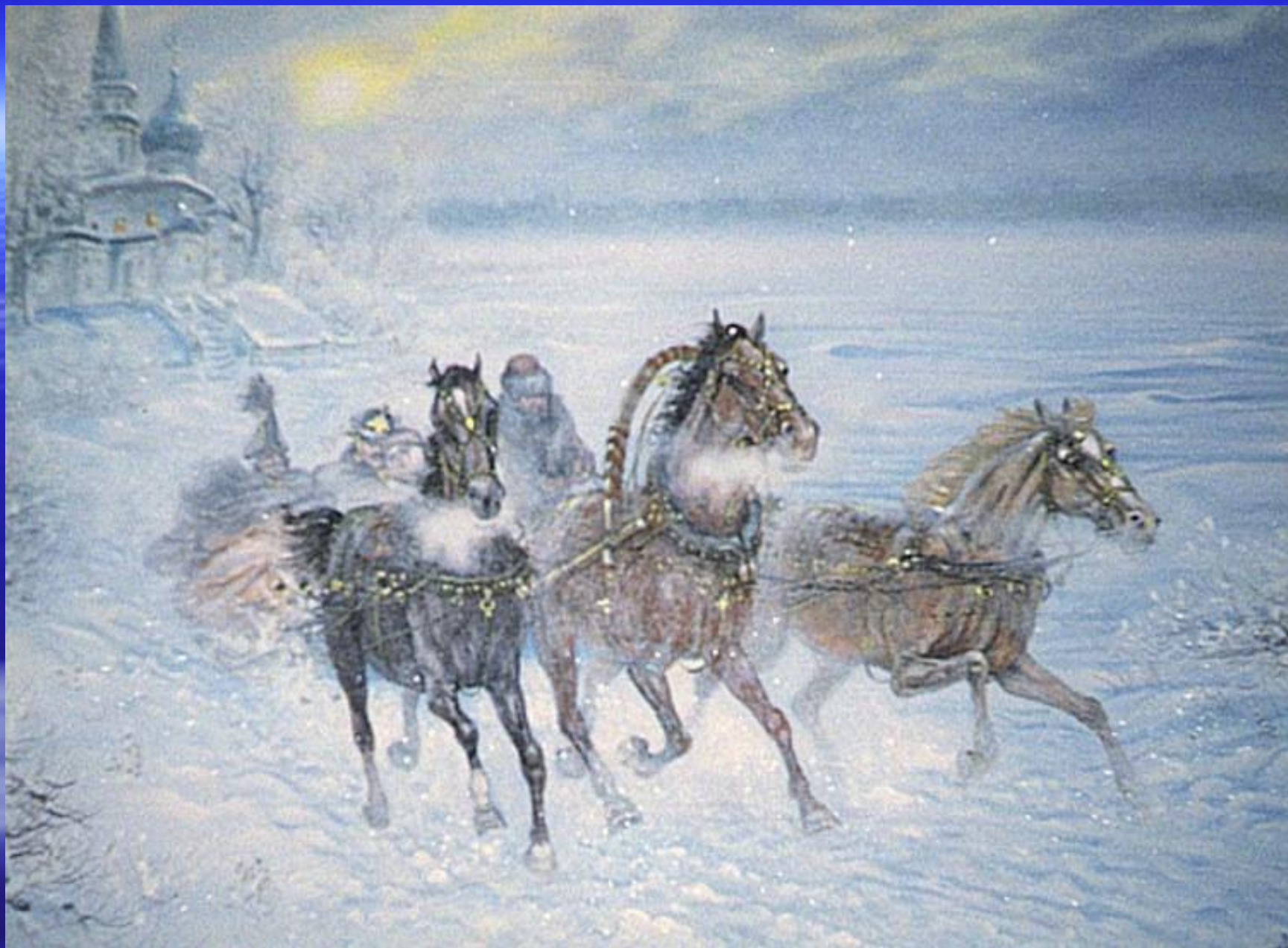
Г. В. Свиридов «Тройка»