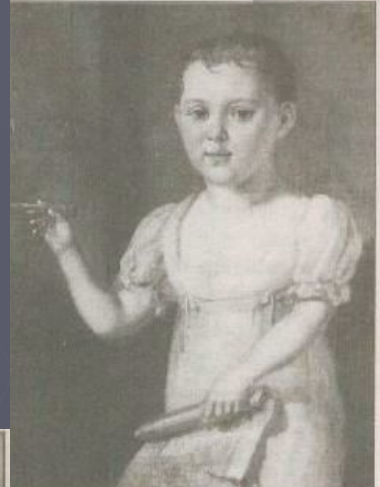
Лермонтов в детстве