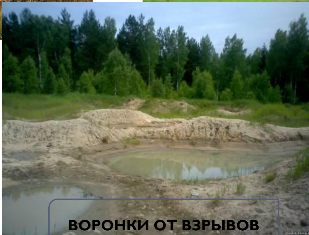
ВОРОНКИ ОТ ВЗРЫВОВ