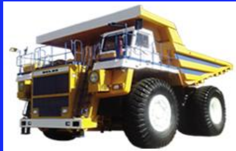
Дистанционно управляемый карьерный самосвал