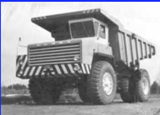
Самосвал БЕЛАЗ–548 грузоподъемностью 40 тонн.