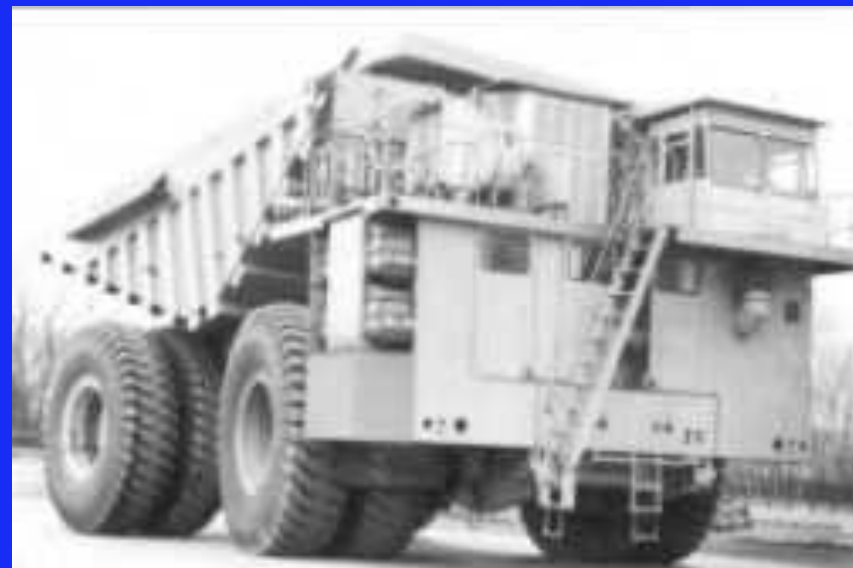
Грузоподъемность 280 тонн