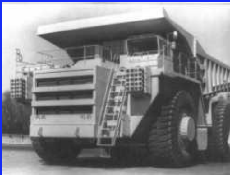
Грузоподъемность 200 тонн