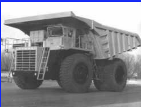
Самосвал БЕЛАЗ–7519 грузоподъемностью 110–120 тонн.