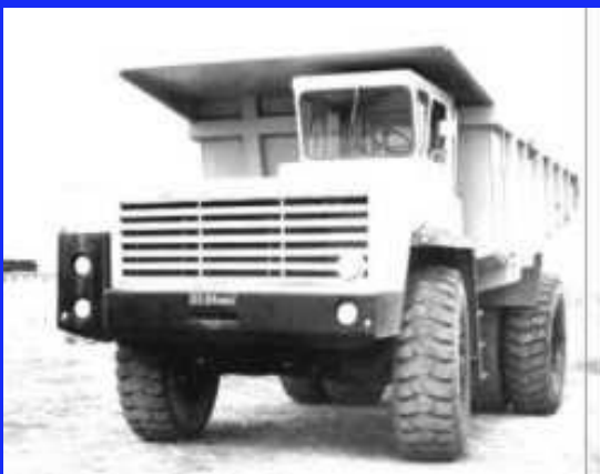
Самосвал БЕЛАЗ–548А грузоподъемностью 40–45 тонн.