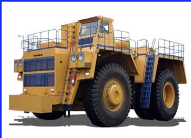
Тягач - буксировщик