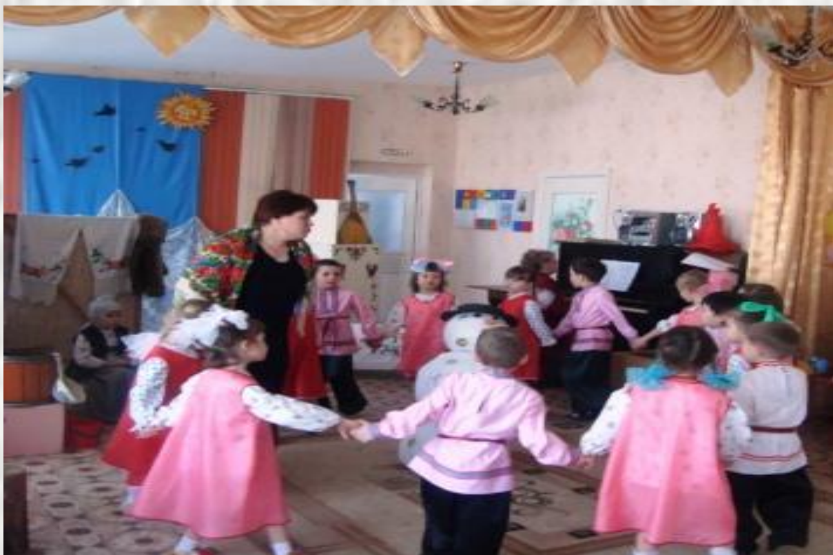
«Песнь о снежной бабе»