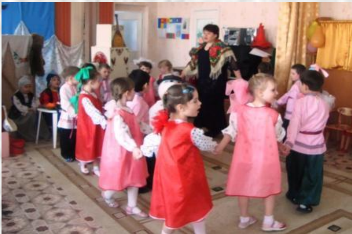
Фольклорная народная игра «Селезень»