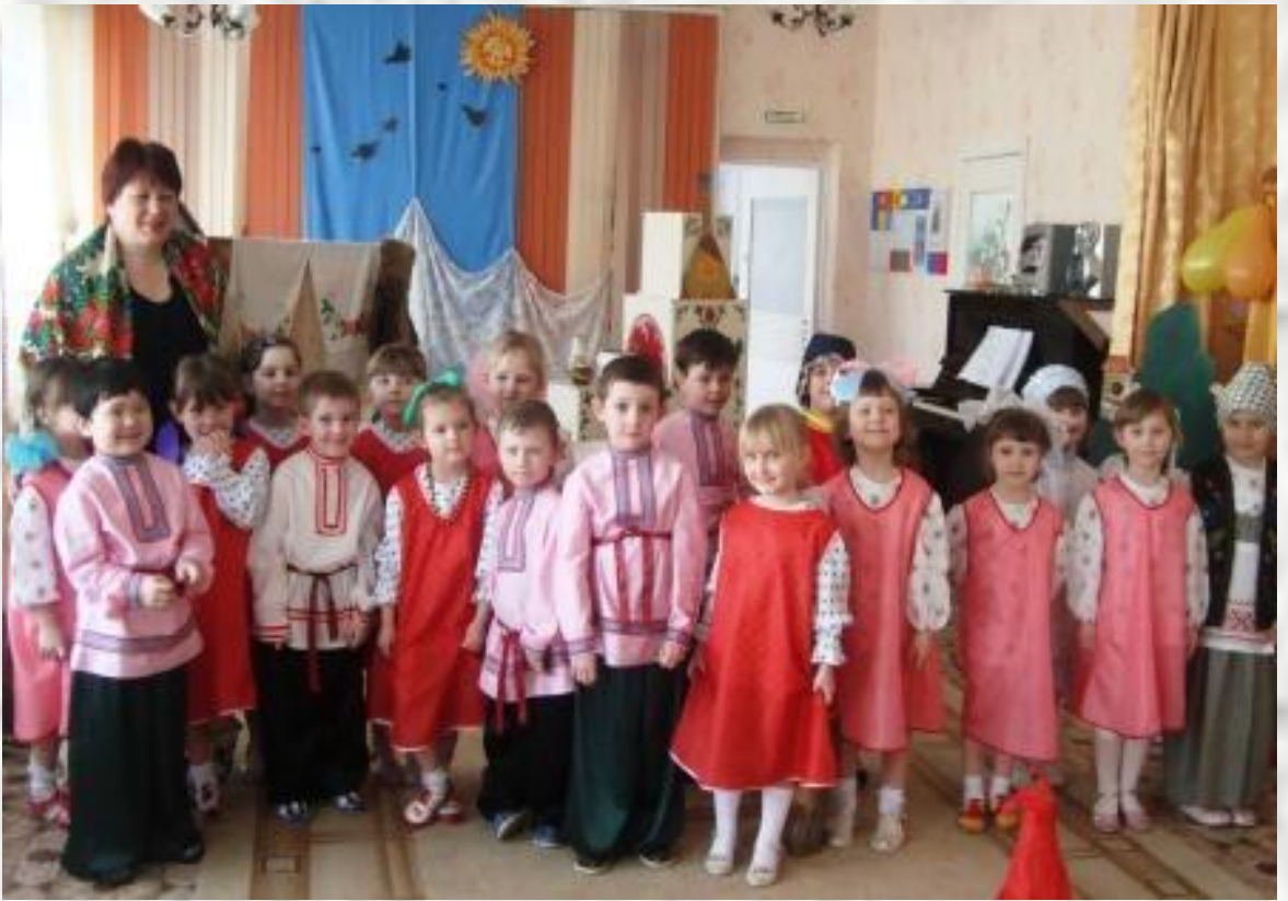
«Сказка -это наша жизнь»