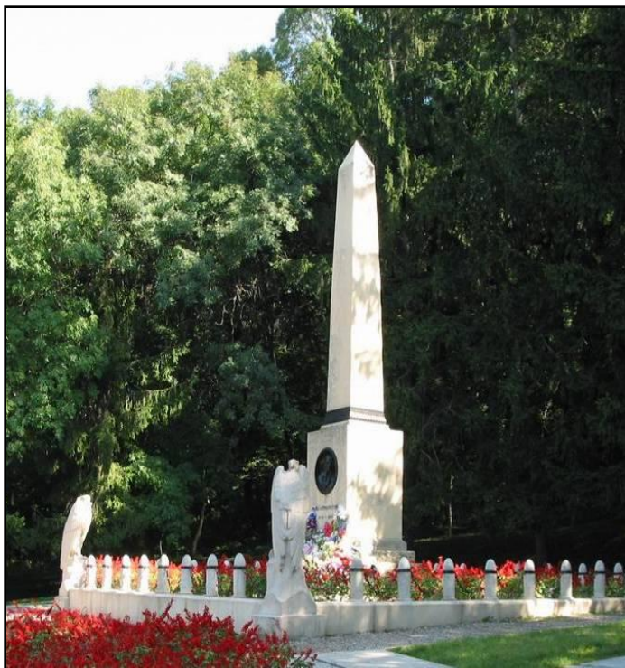
Памятник на месте дуэли М.Ю Лермонтова в Пятигорске