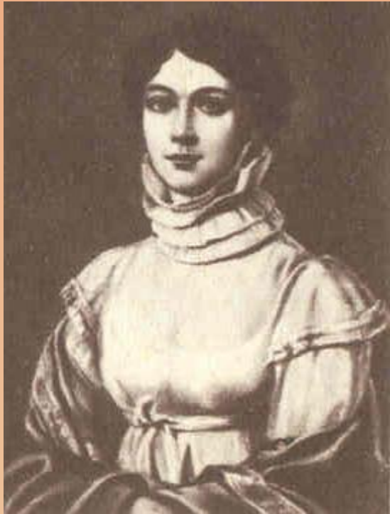
Елизавета Алексеевна Арсеньева