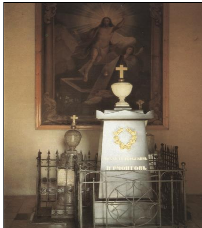
Памятник над могилой М.Ю. Лермонтова в Тарханах