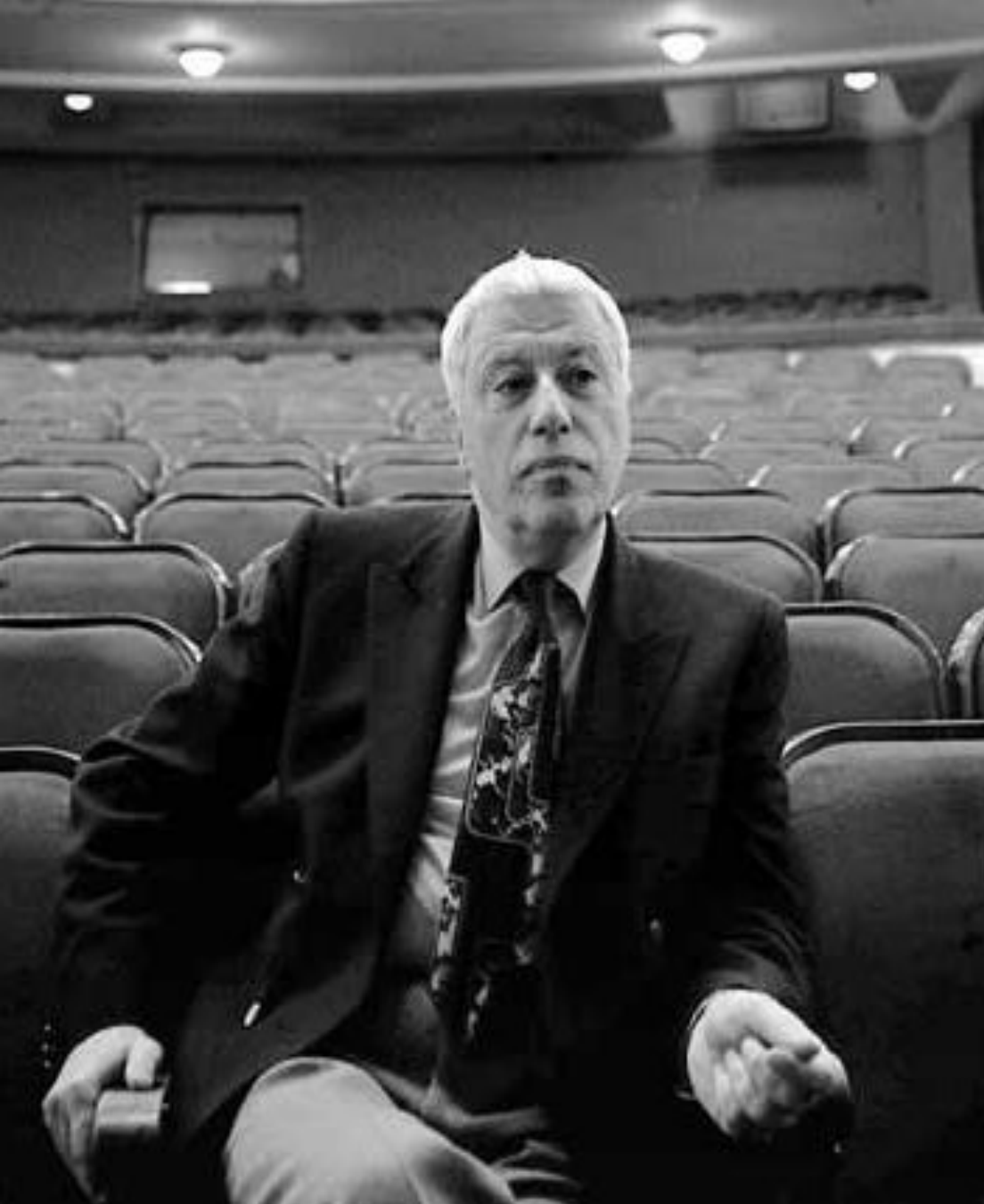
Константин Михайлович Симонов (1915-1979)