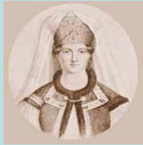
Елена Глинская – мать Ивана Грозного