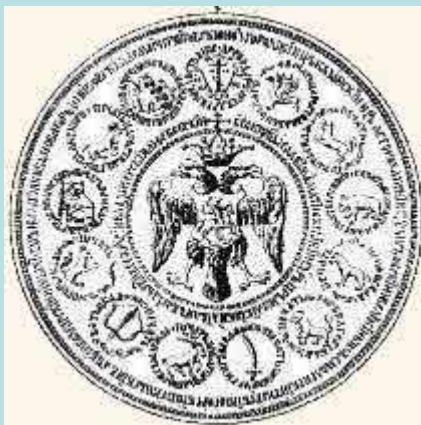
Печать Ивана Грозного