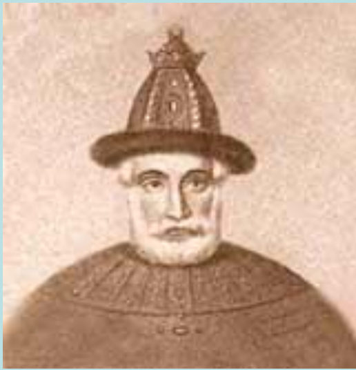
Василий III – отец Ивана Грозного