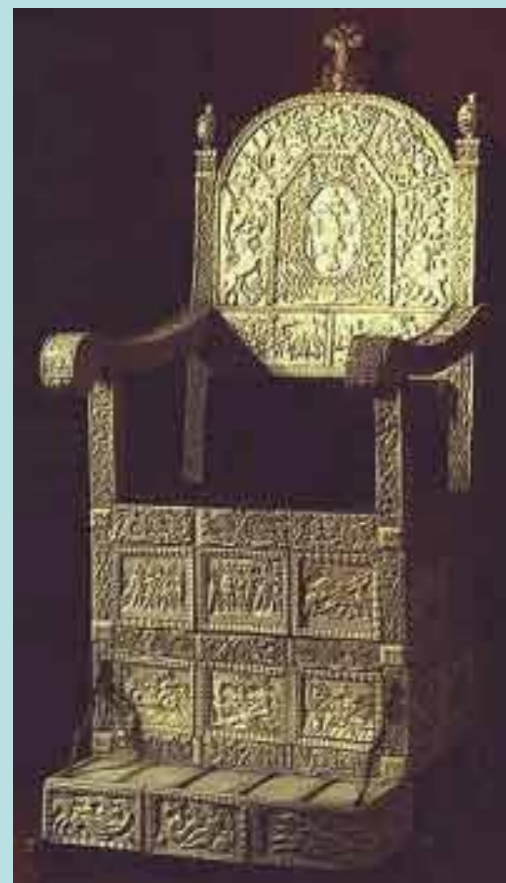
Трон Ивана Грозного