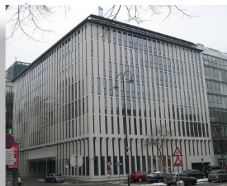
Щтаб – квартира ОПЕК в г.Вена