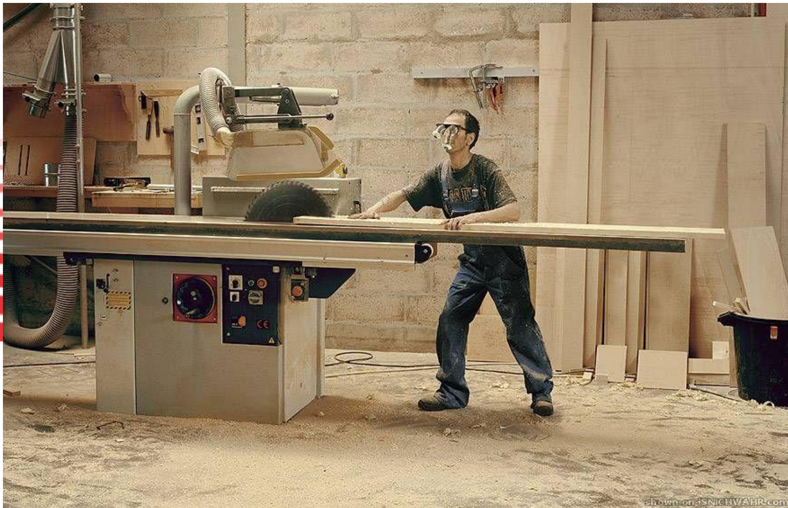
Ansell vision draft2