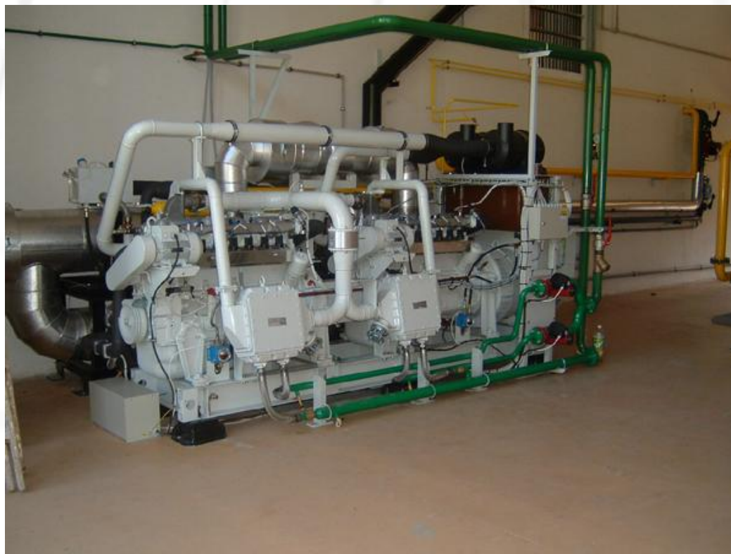
Серия TEDOM T300