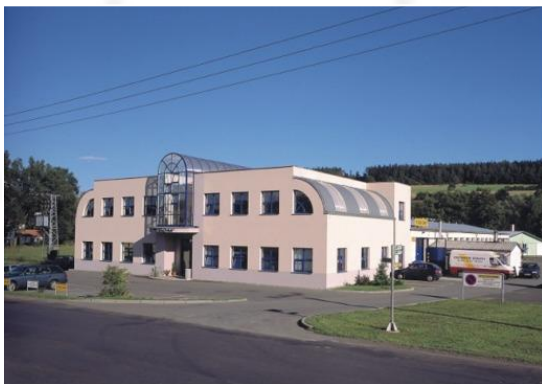
Завод-изготовитель в городе Горжовице