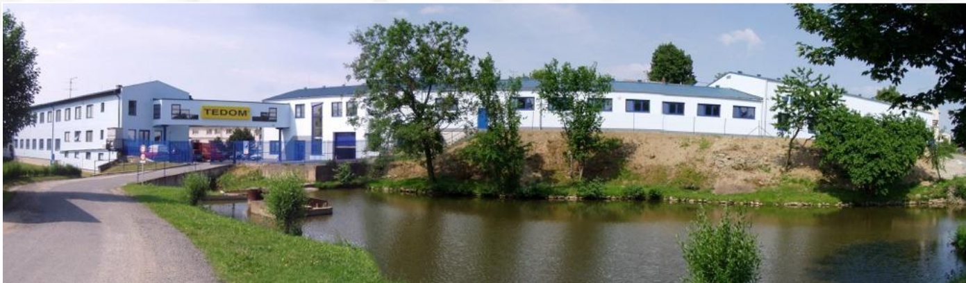
Местонахождение фирмы в городе Вычапы