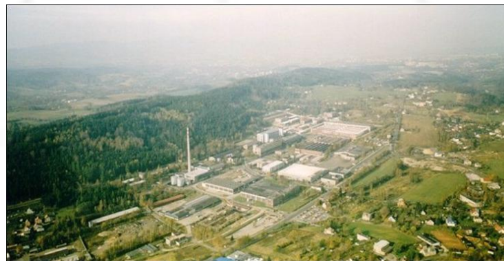
Завод-изготовитель TEDOM Motory в городе Яблонец над Нисоу