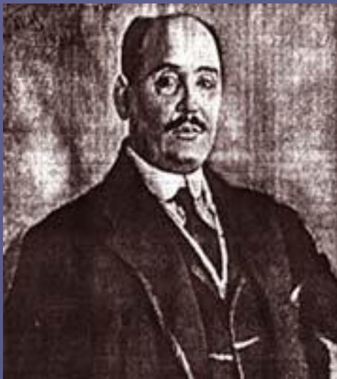
С.В.Малютин. Портрет Н. П. Богданова –Бельского. 1915 г.

Картины Богданова-Бельского автобиографичны, написаны с любовью к крестьянским детям, в которых пробиваются ростки духовной жизни, в них раздумья художника о печальной участи детей, его гражданская позиция человека.