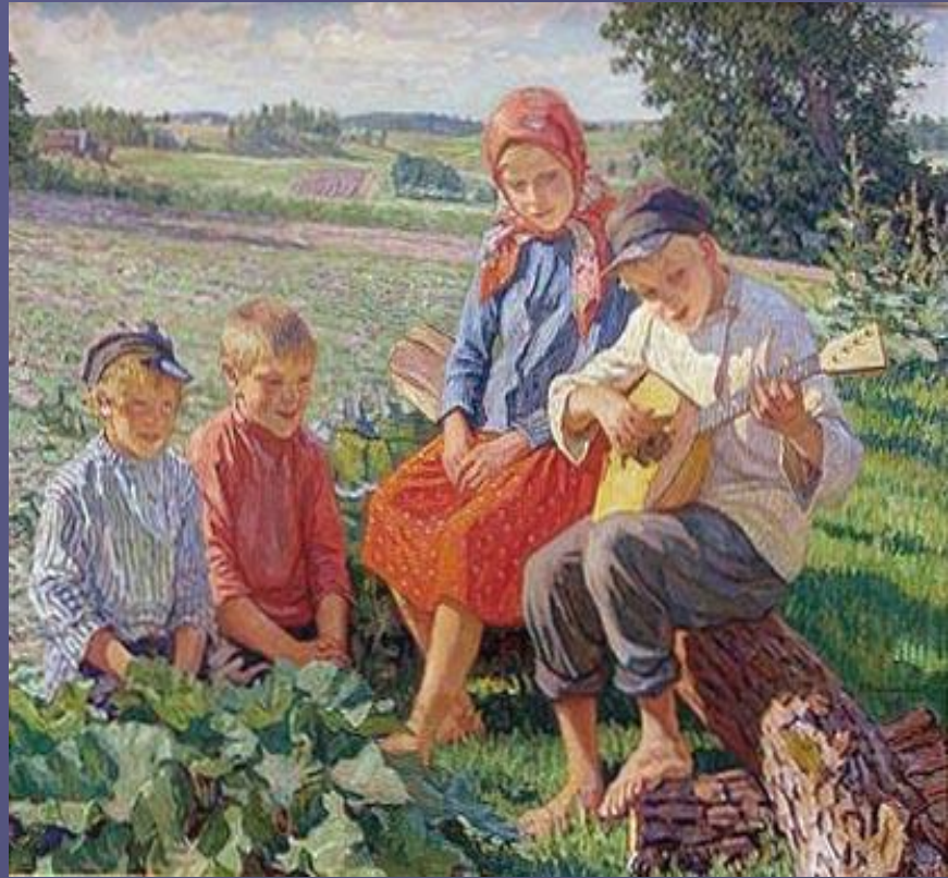
Дети. Игра на балалайке. 1937