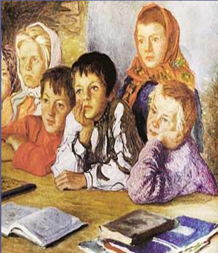
Дети на уроке. 1918 г.