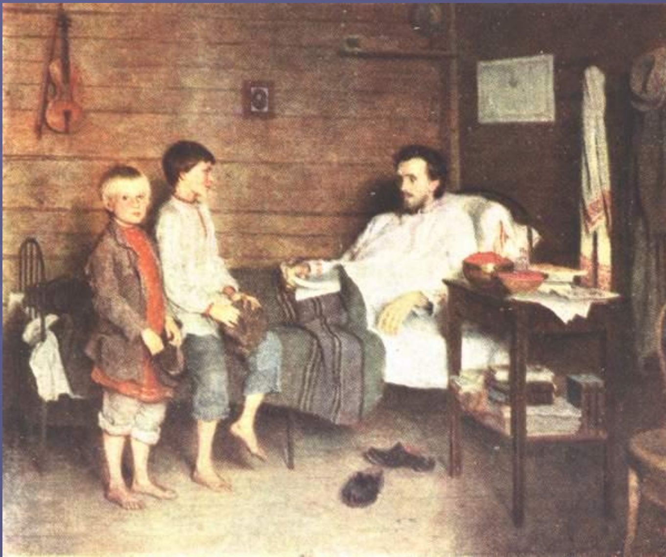
У больного учителя. 1897 г.