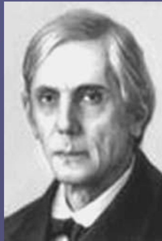
Сергей Александрович Рачинский