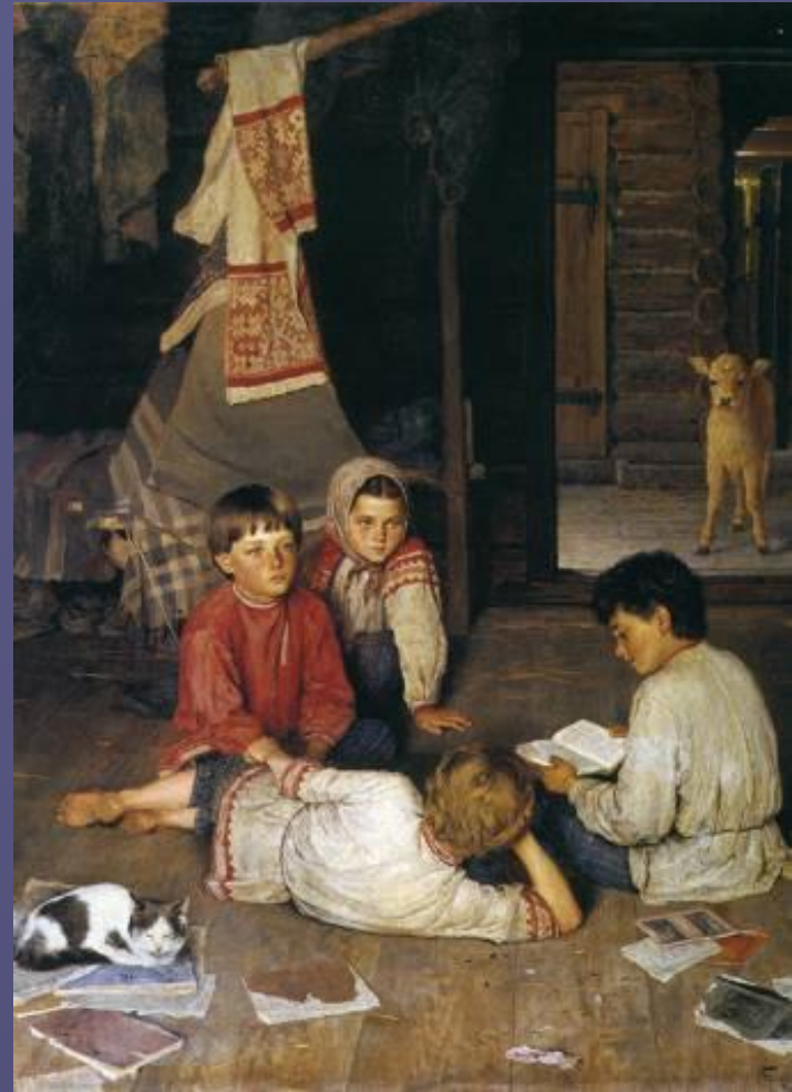
Новая сказка. 1891