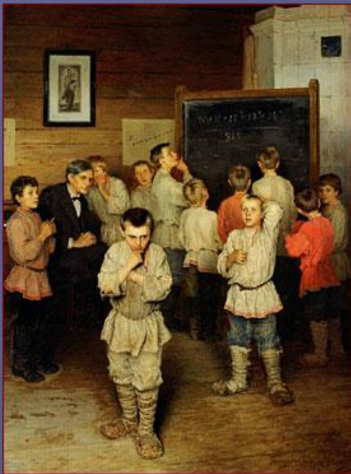
Устный счет. 1895 г.