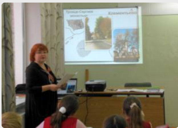
Русский язык. Тема «Состав слова», 3 класс