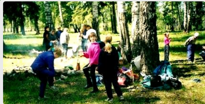
В лесу на привале