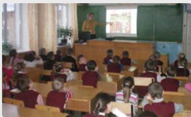
Литературное чтение. Тема: «Житие Сергия Радонежского», 4 класс