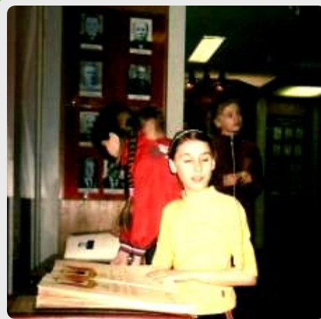
Музей завода г. Краснозаводска