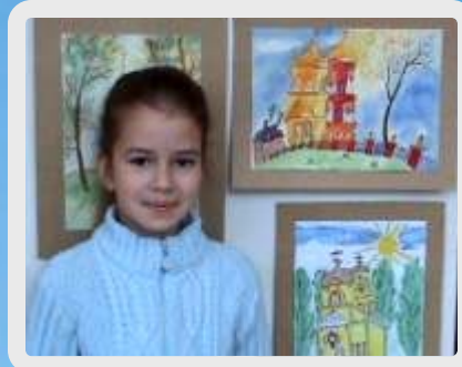
Победитель конкурса рисунков «Святыни Радонежья»