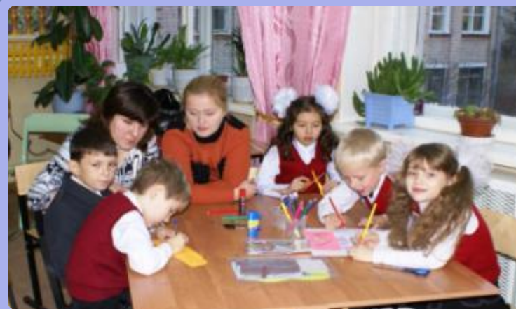
Урок – проект «Город будущего»