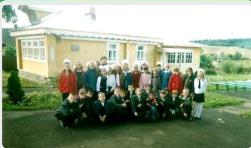
Дом-музей В.Ф. Бокова