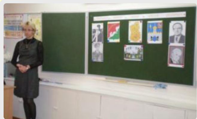
Русский язык. Тема: «Собственные имена существительные», 2 класс