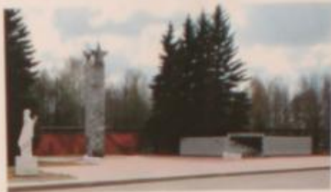
В настоящее время, в городе проживает 40 ветеранов Великой Отечественной войны.