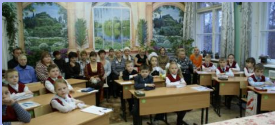
«Моя семья в судьбе района»