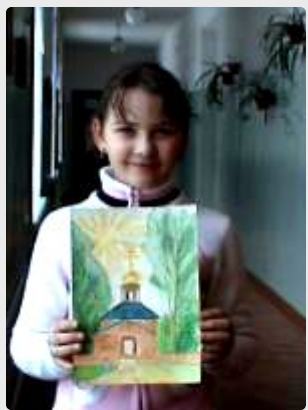
Лауреат конкурса рисунков «Святыни Радонежья»