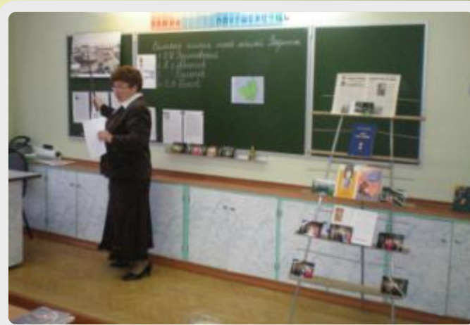
Окружающий мир. Тема: «Наш дом –Россия», 1 класс