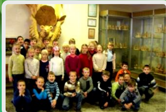
Музей Богородской деревянной игрушки