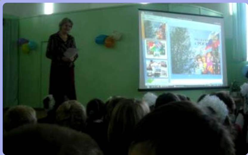
Урок – путешествие «Мы живём в России»