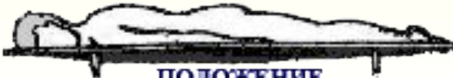
ПОЛОЖЕНИЕ НА ЖИВОТЕ