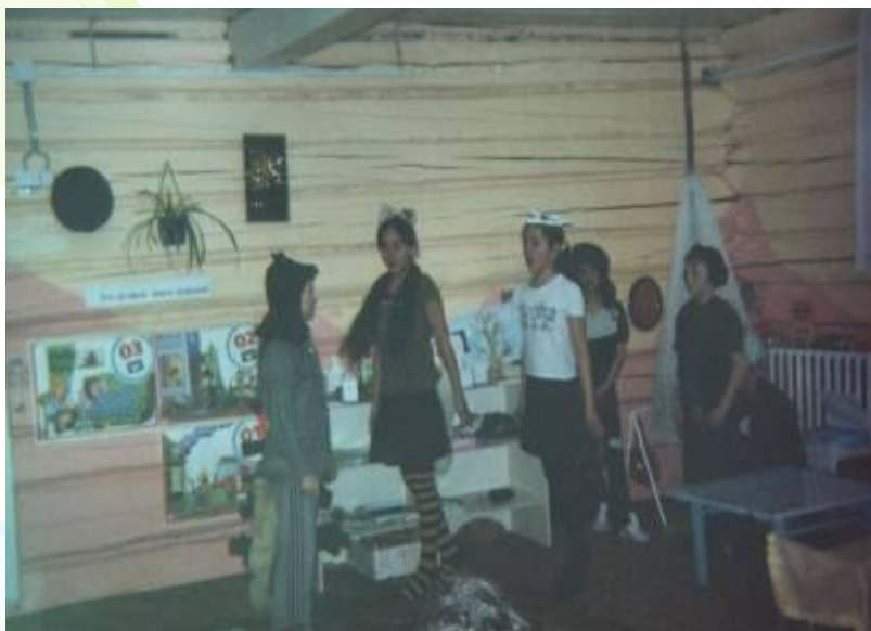
Кружок «Актерское мастерство «Родничек»