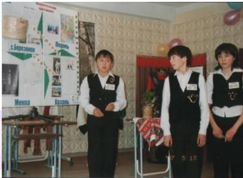
Кружок «Двери открывает музей»