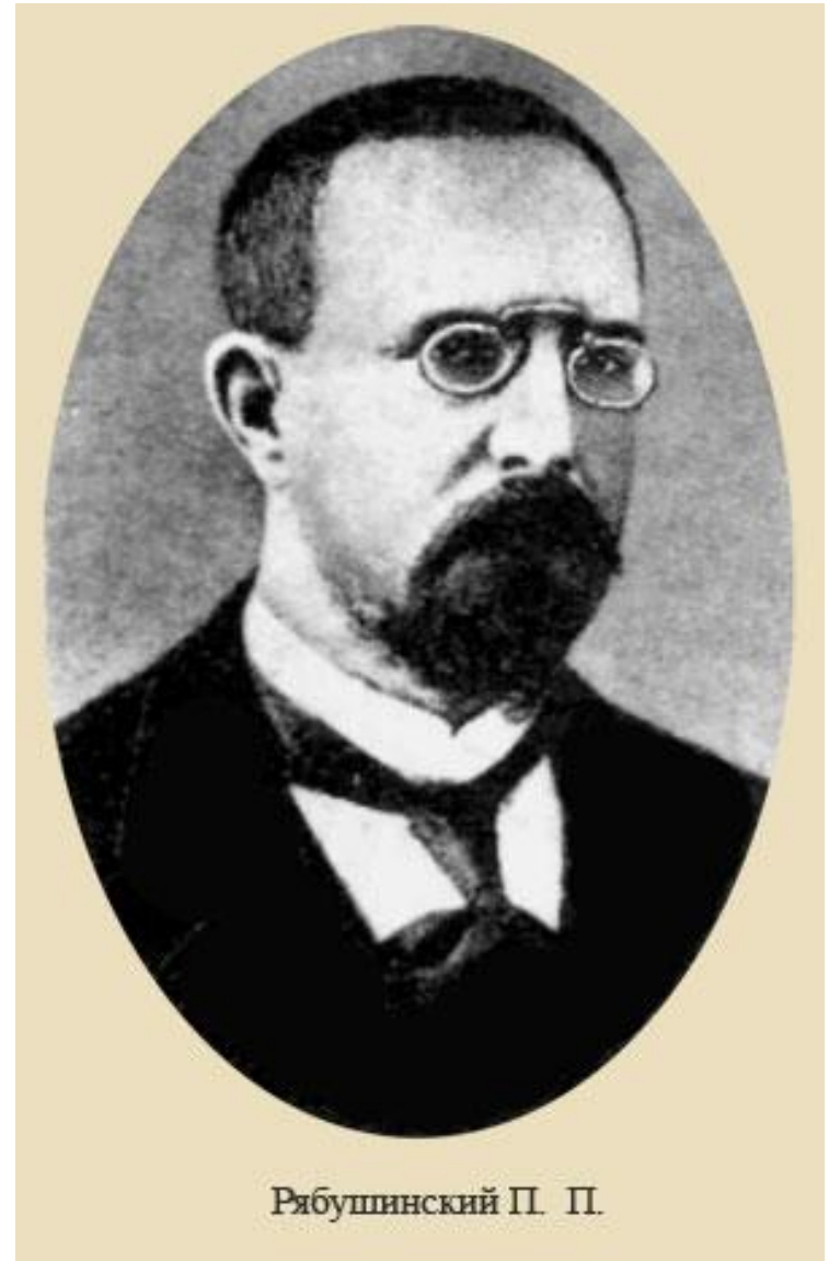
Рябушинский П. П.