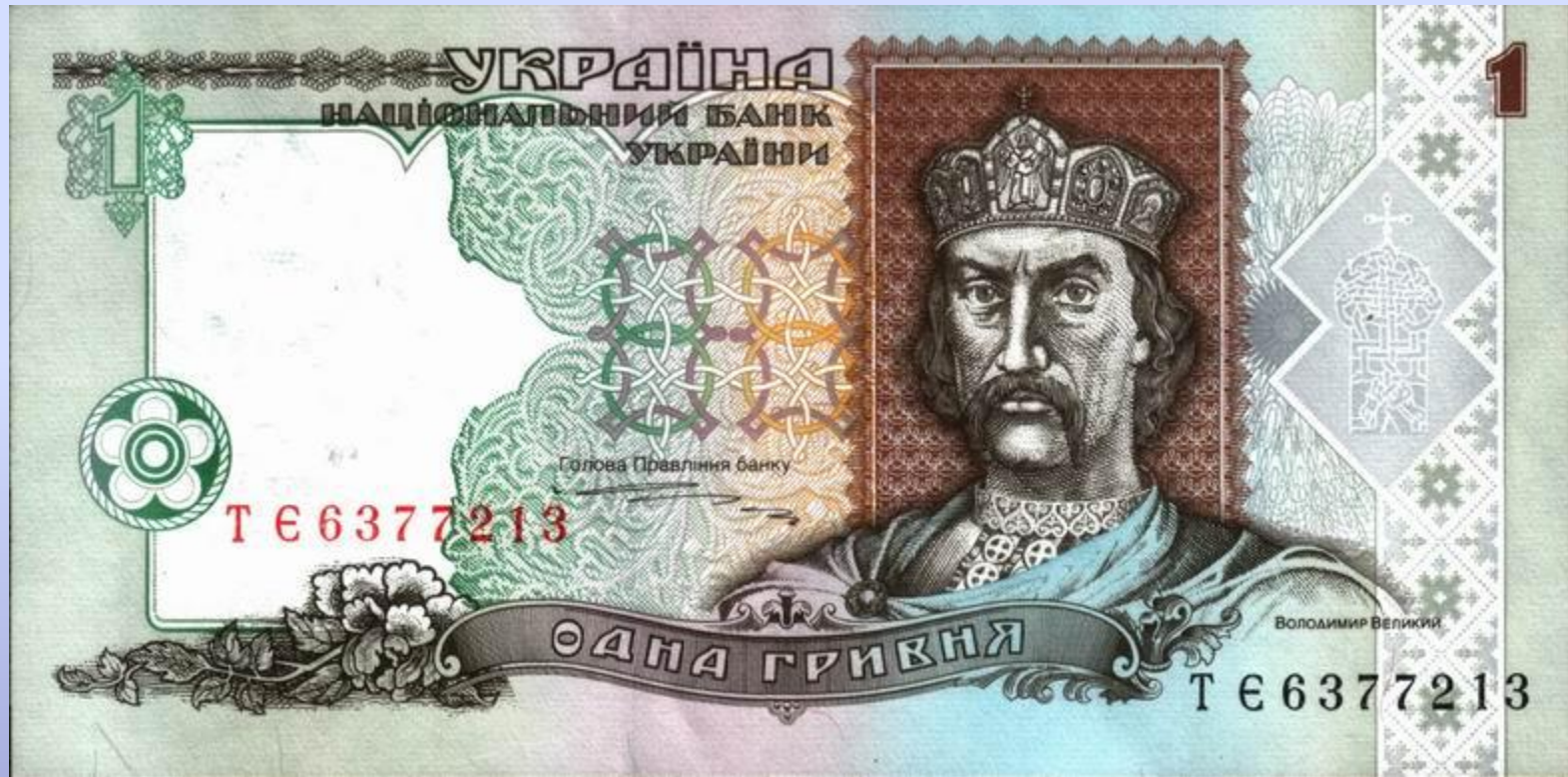
Владимир Великий (1994)

на др. банкнотах: Ярослав Мудрий, Богдан Хмельницький, Иван Мазепа, Иван Франко, Михайл Грушевський, Тарас Шевченко, Леся Українка