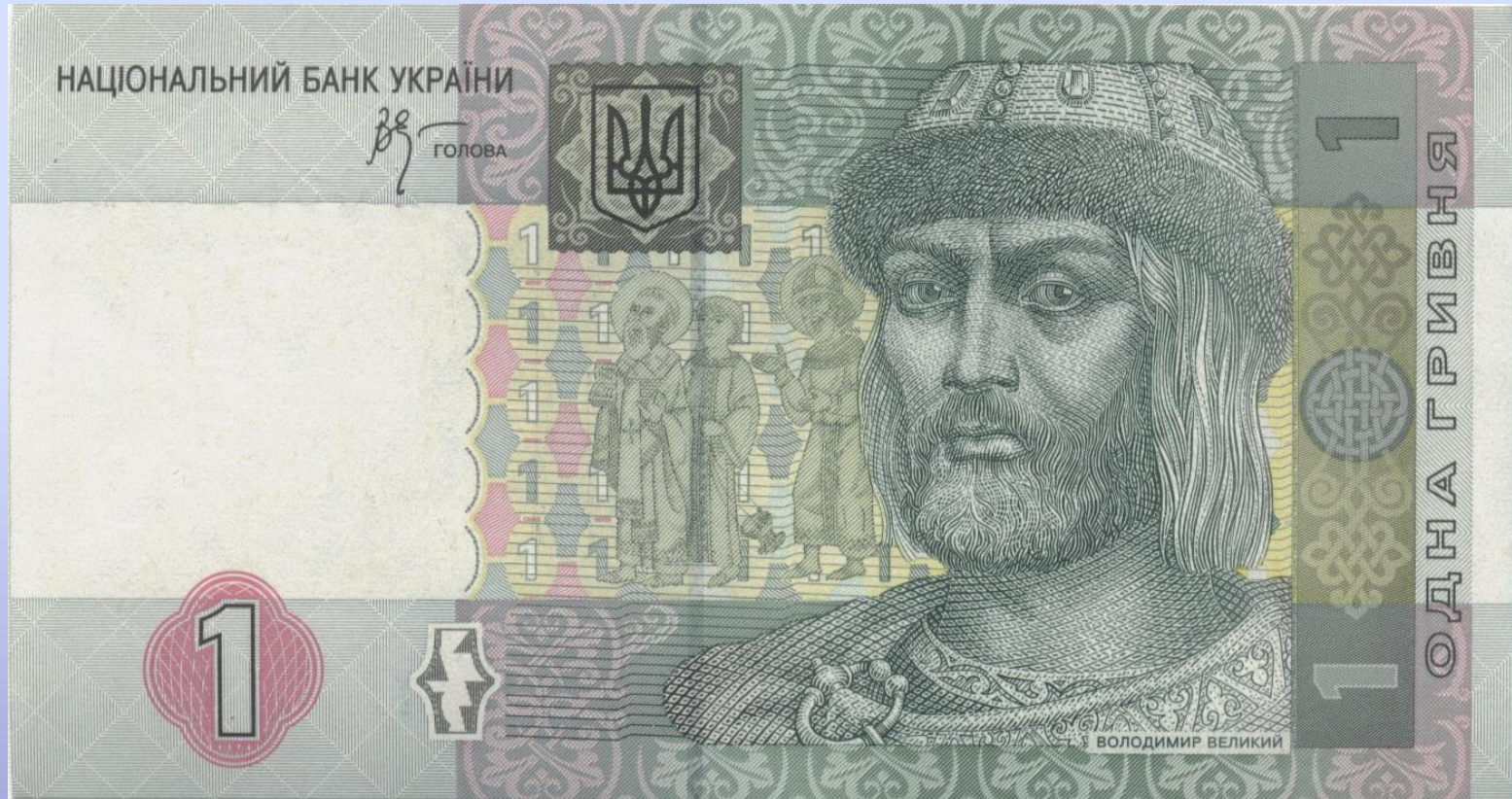
Владимир Великий (2004)

на др. банкнотах: Ярослав Мудрий, Богдан Хмельницький, Иван Мазепа, И. Франко, М. Грушевський, Т. Шевченко, Леся Українка, Г. Сковорода