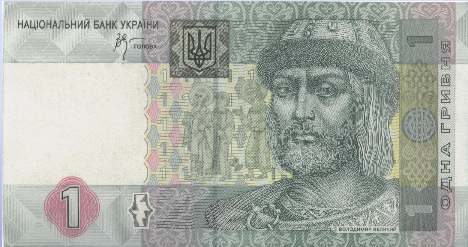
Владимир Великий (2004)

на др. банкнотах: Ярослав Мудрий, Богдан Хмельницький, Иван Мазепа, И. Франко, М. Грушевський, Т. Шевченко, Леся Українка, Г. Сковорода