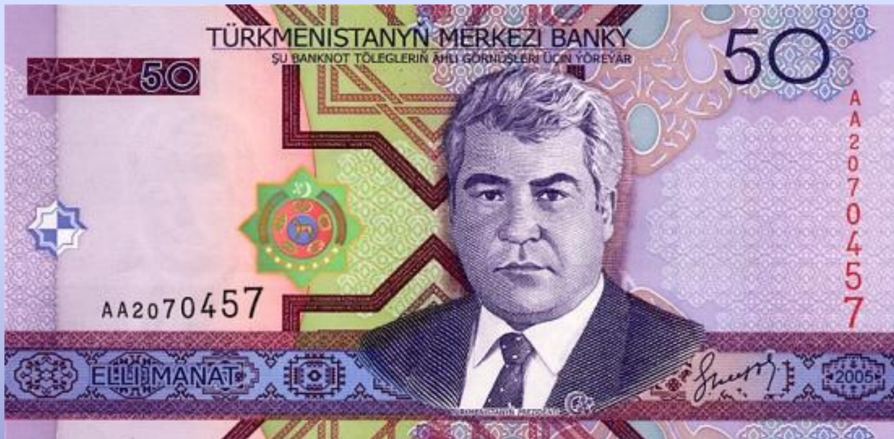
Сапармурат Ниязов – Туркменбаши (2005)