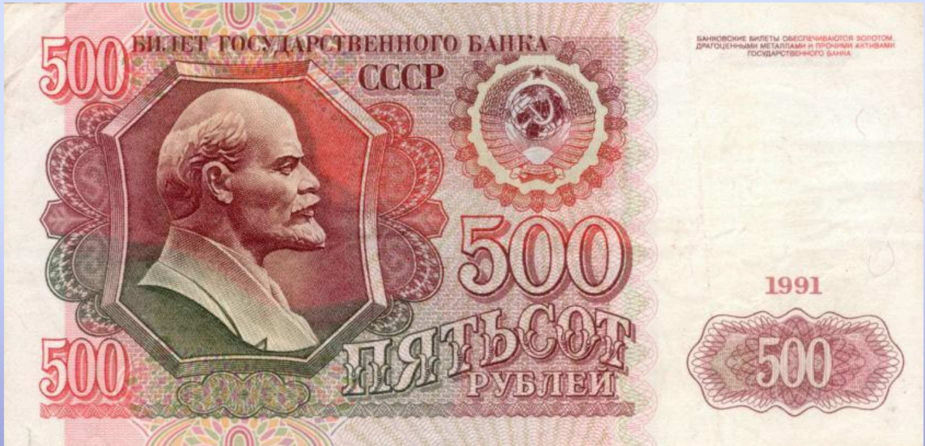
Владимир Ильич Ленин (1991)