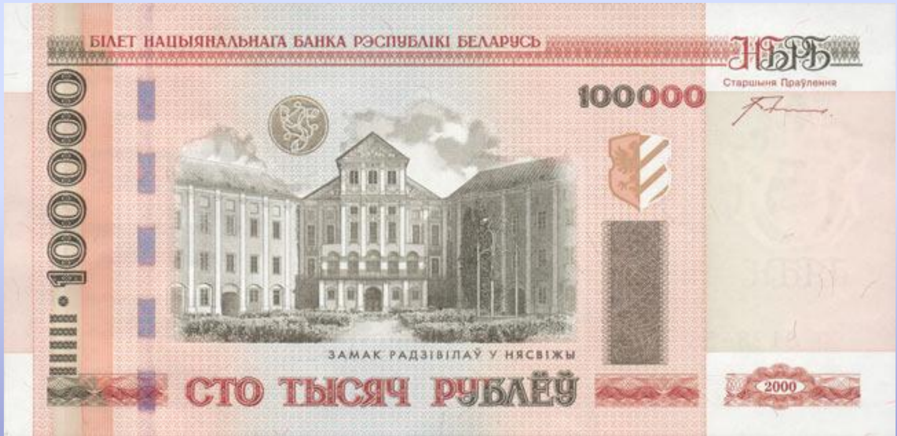
Замок Радзивиллов в Несвижи (2005)