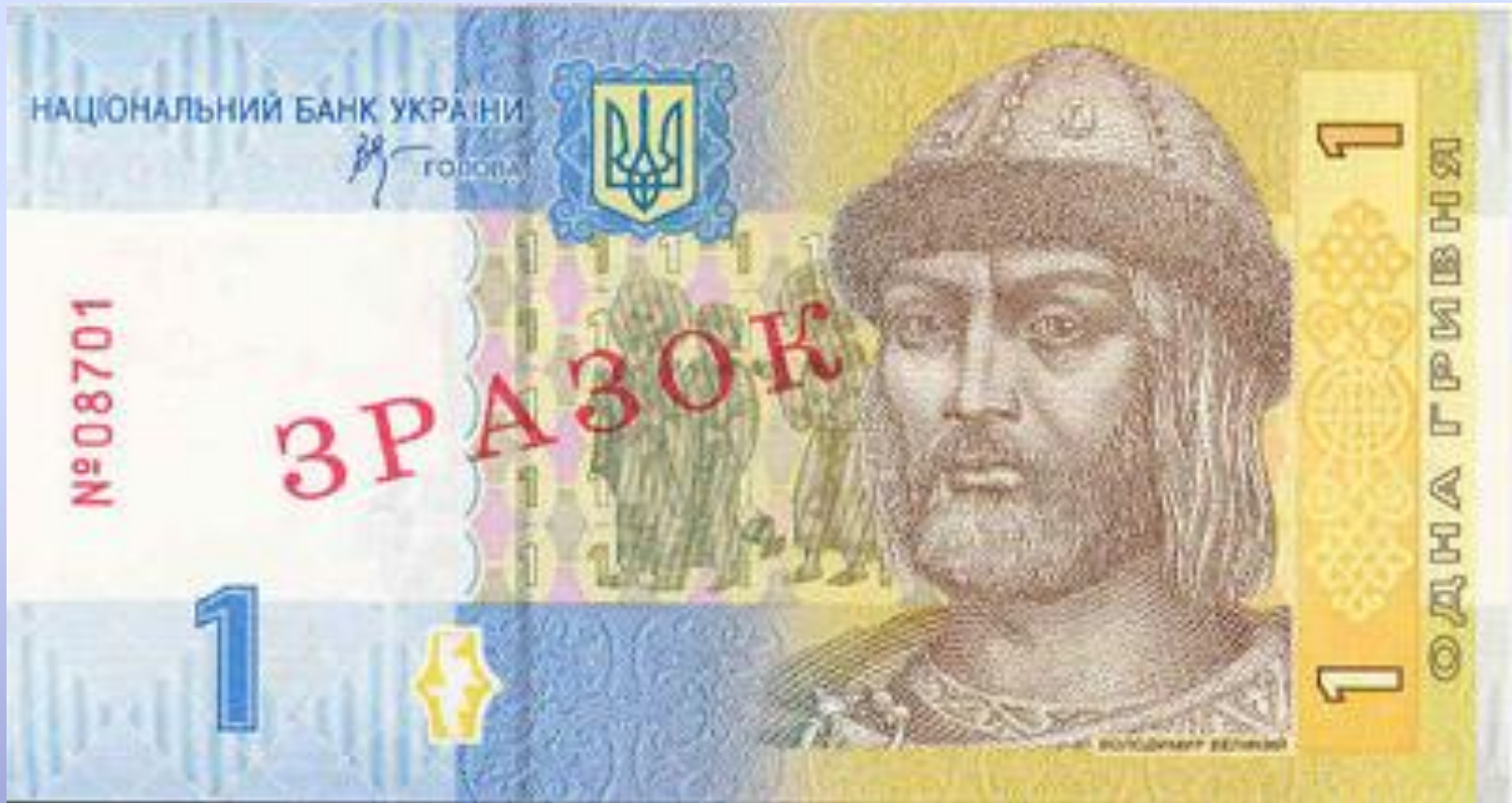
Владимир Великий (2006)

на др. банкнотах: Ярослав Мудрий, Богдан Хмельницький, Иван Мазепа, И. Франко, М. Грушевський, Т. Шевченко, Леся Українка, Г. Сковорода