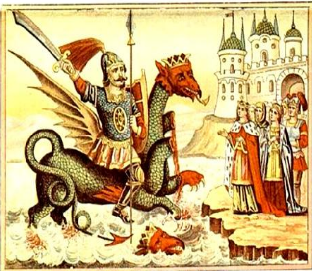
Славный Сильный и Храбрый Витязь Ерусланъ Лазаревичъ ѣдетъ на Чудо Великомъ Змѣи.

В сознании народа жило обостренное чувство