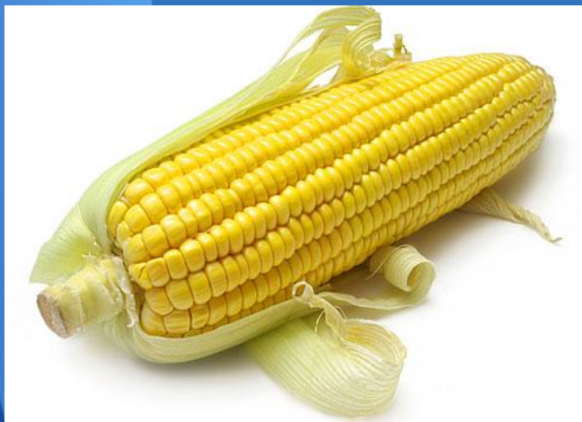
Кукуруза – царица полей