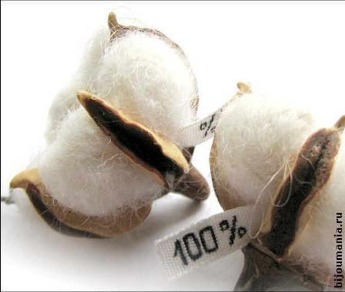
Хлопок - белое золото