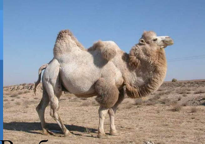
Верблюд – корабль пустыни