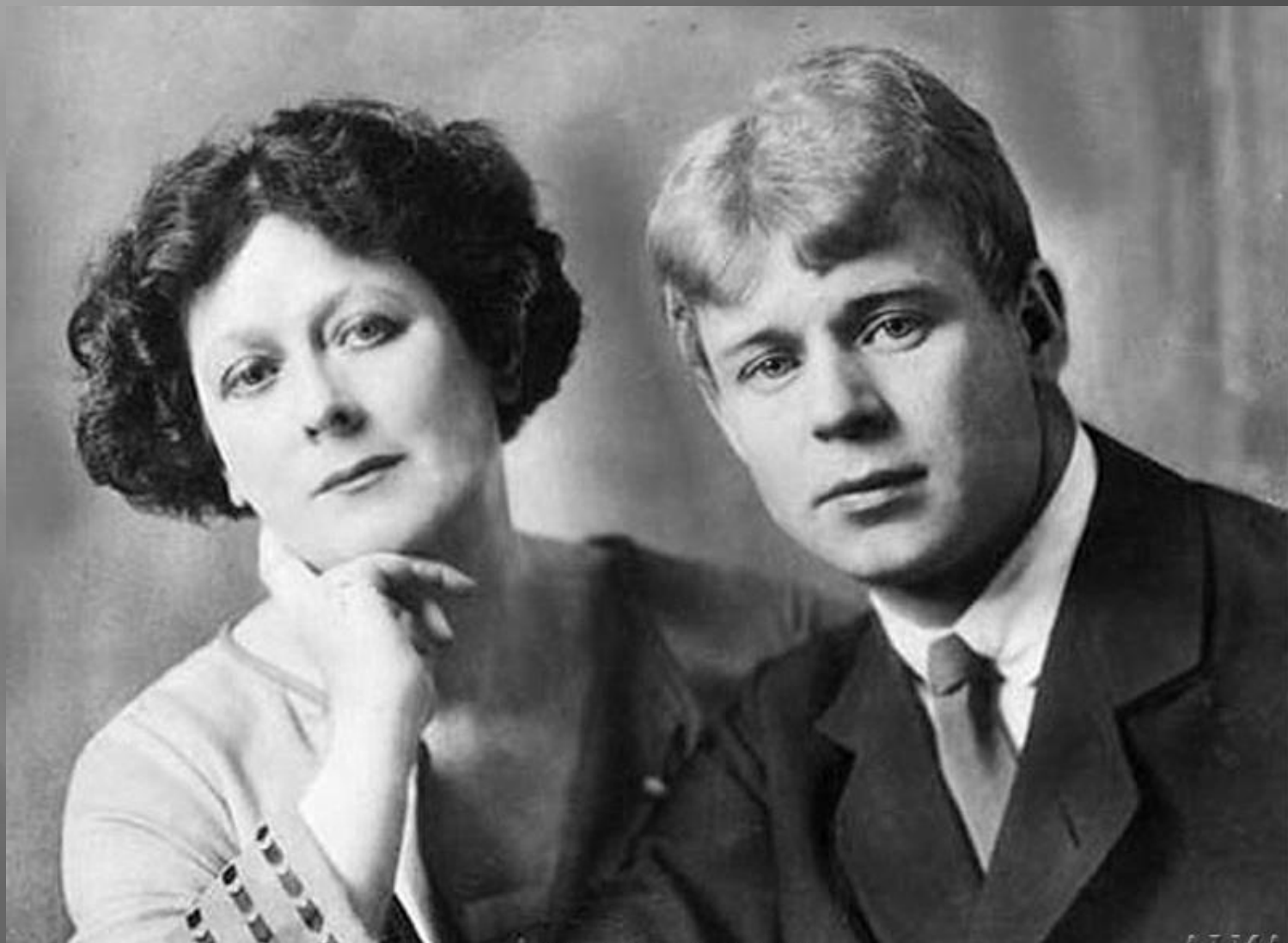
Есенин и Айседора Дункан, 1923