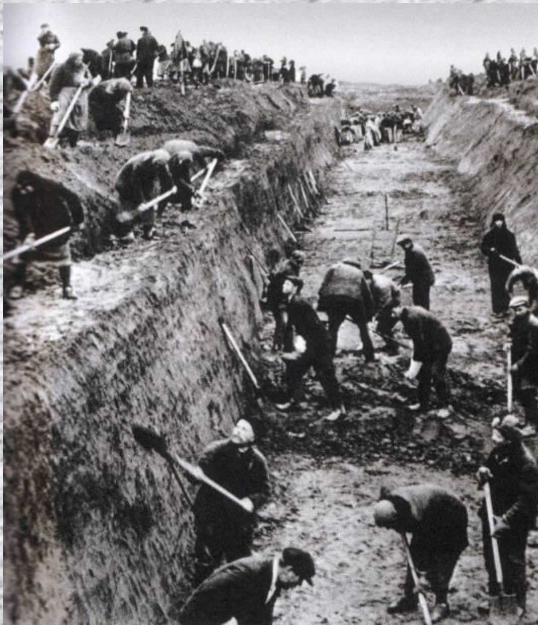
Москвичи на строительстве оборонительных рубежей.