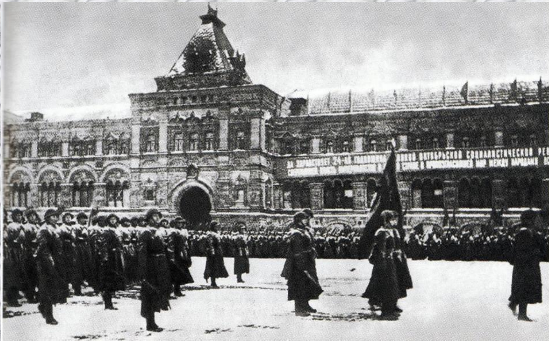
Военный парад на Красной площади 7 ноября 1941 года.