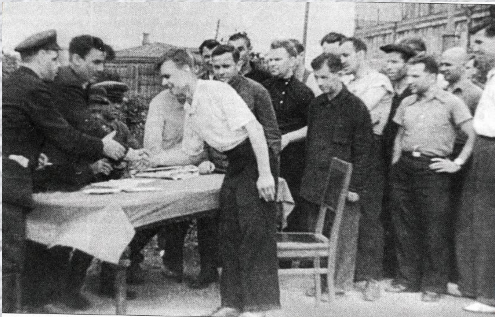
Рабочие завода записываются в народное ополчение.