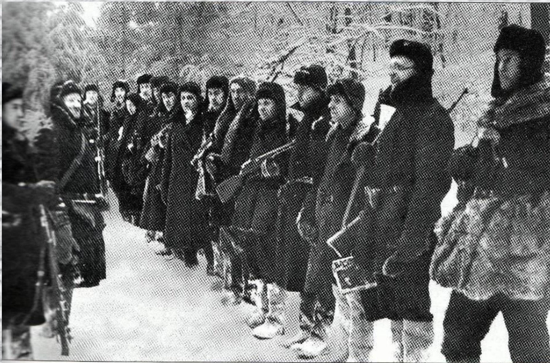
Партизаны перед выходом на боевое задание.