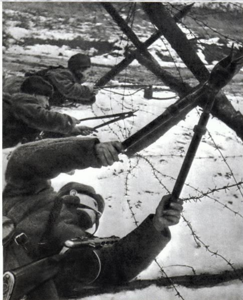
Саперы готовят проходы в заграждениях перед контрнаступлением.