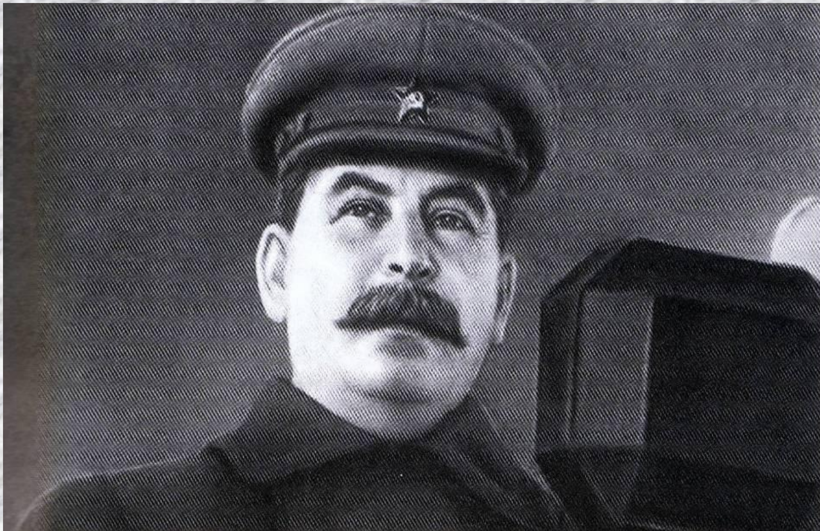
На трибуне Мавзолея – Верховный Главнокомандующий Иосиф Виссарионович Сталин. Выступление перед красноармейцами 7 ноября 1941 года.