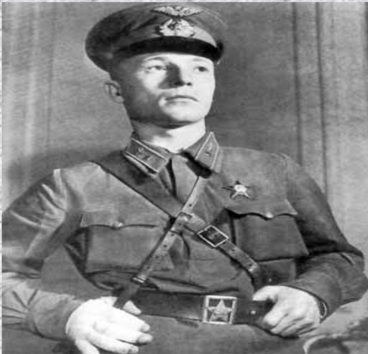
Герой лётчик Виктор Талалихин.