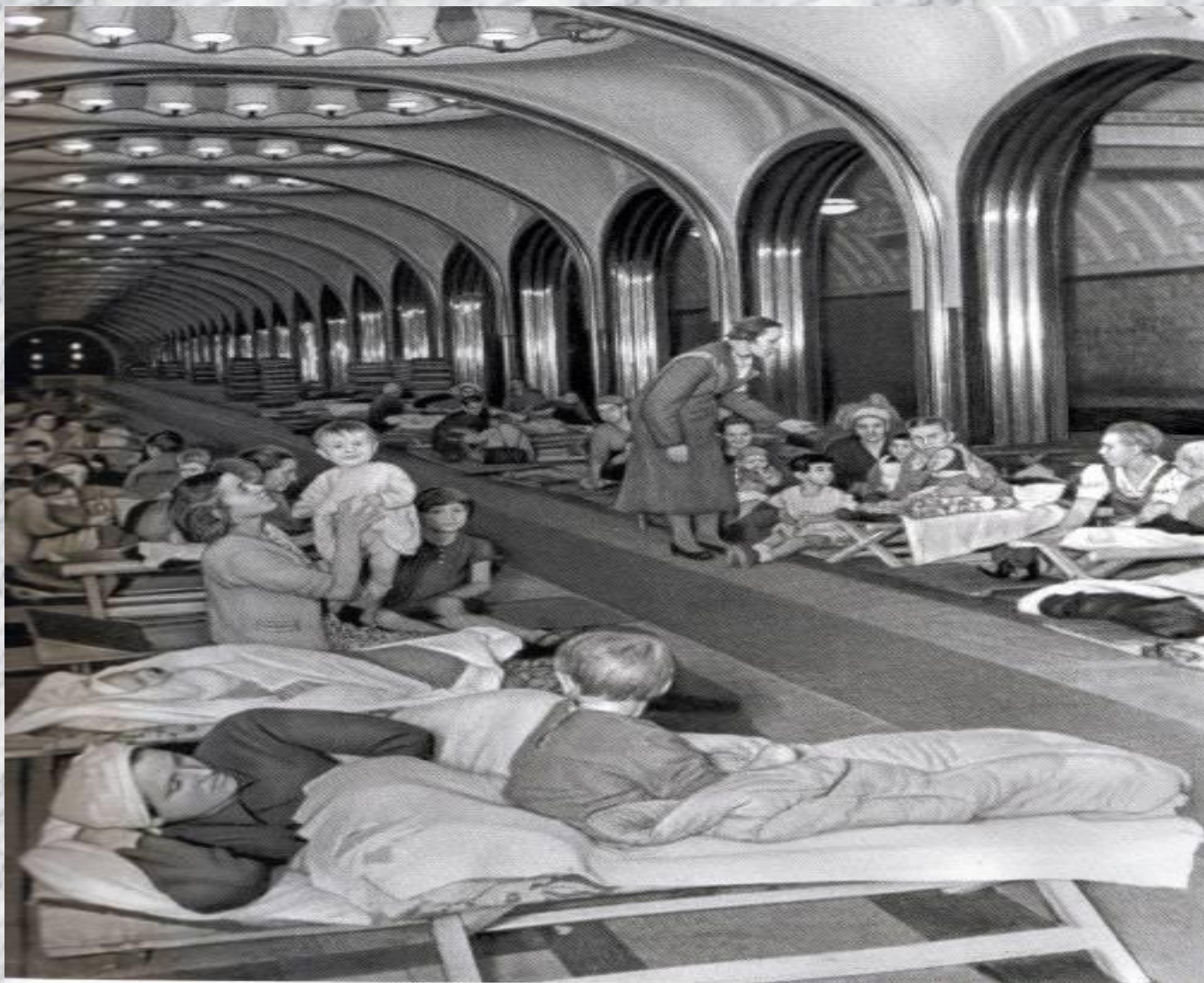
Станция метро «Маяковская» во время воздушной тревоги.