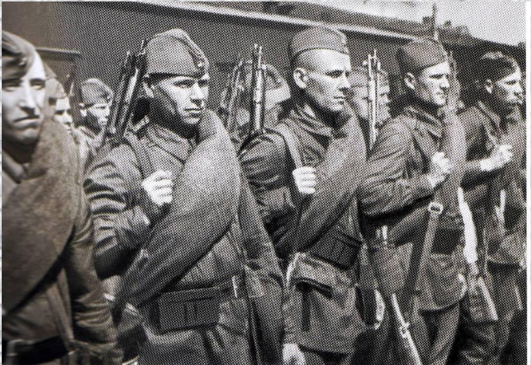
Призывники перед отправкой на фронт.