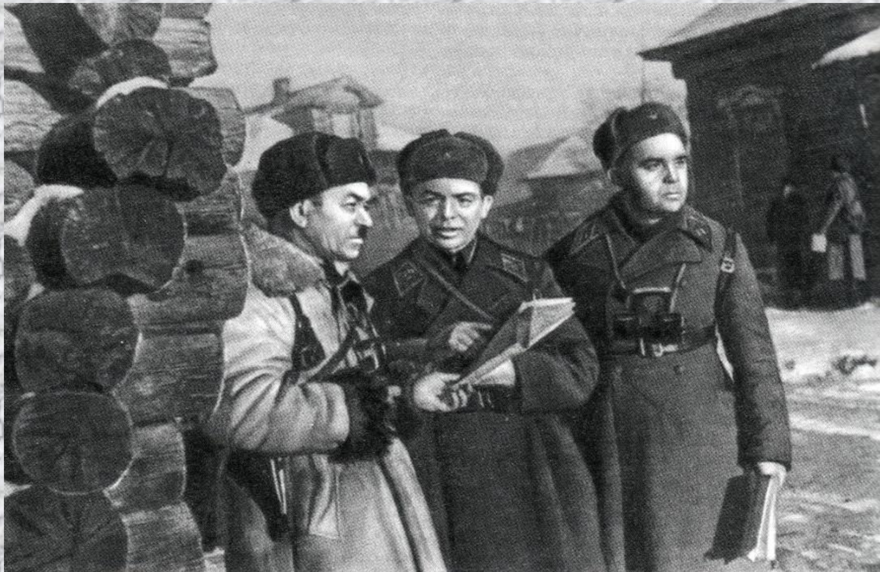
Генерал-майор И.В.Панфилов (слева) с командирами штаба дивизии.