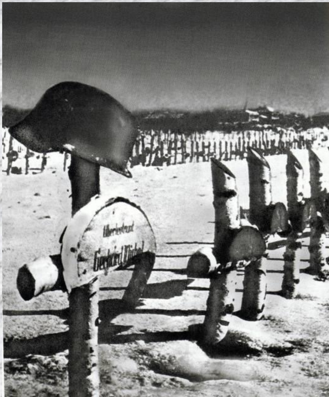
Финал Московской битвы.