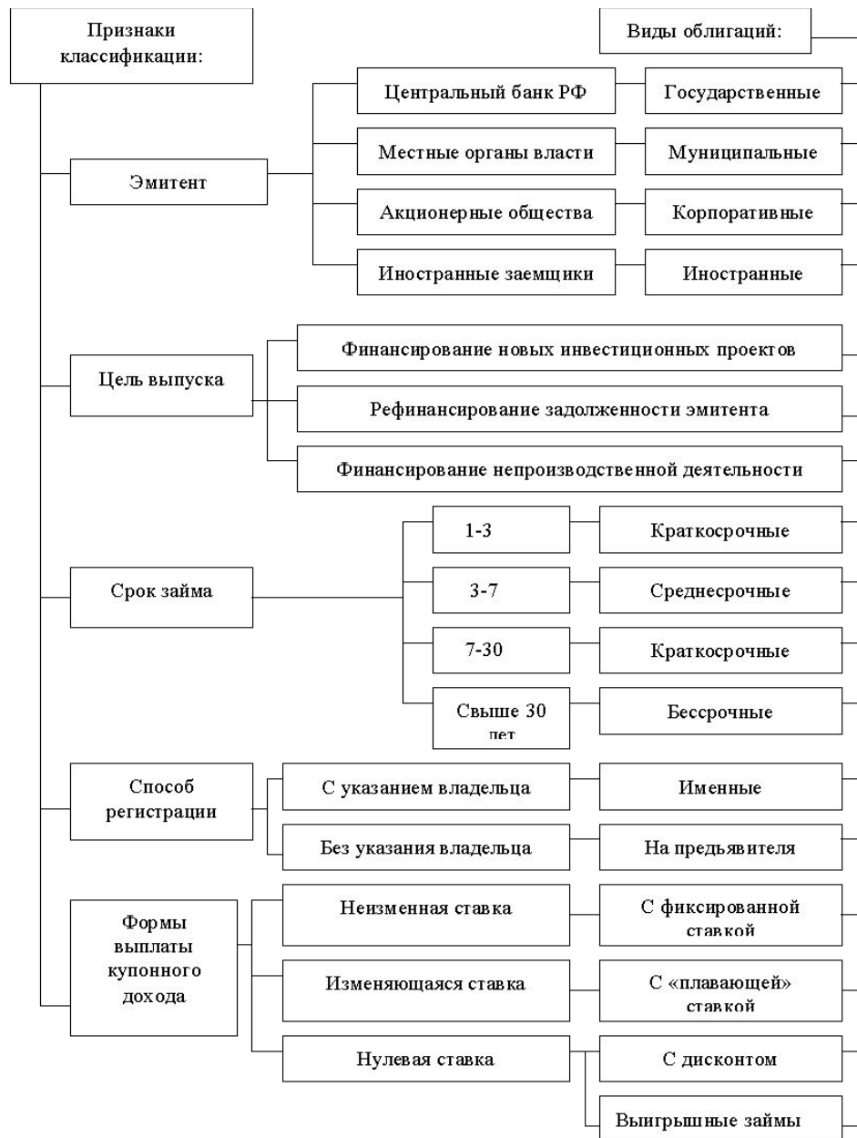
Рис. 1.3 общая схема классификации облигаций