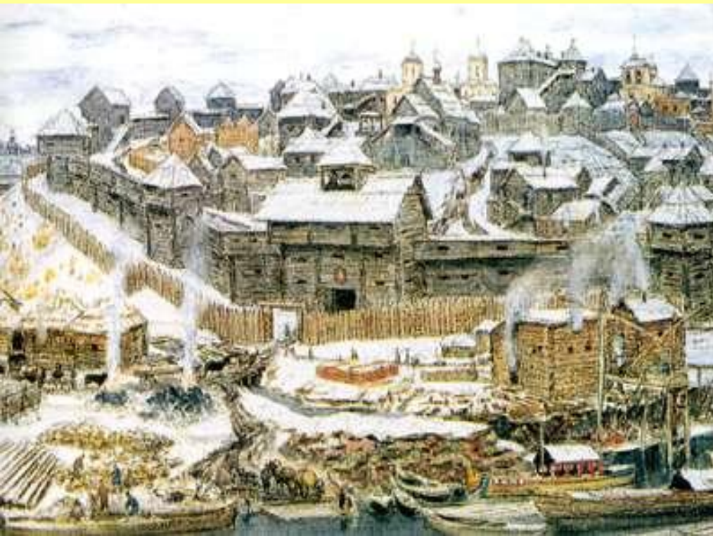
Деревянный Кремль Ивана Калиты. Худ. А. Васнецов.

Построил в Кремле несколько каменных соборов и дубовые стены.