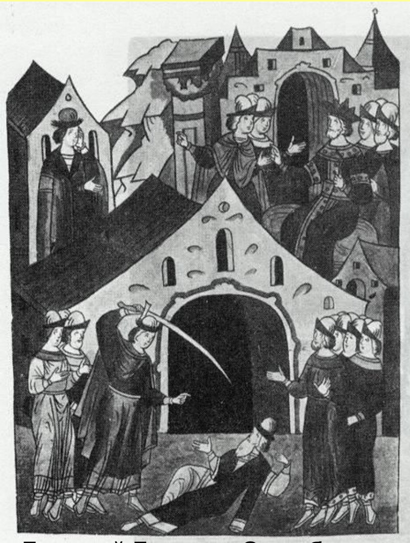
Дмитрий Грозные Очи убивает Юрия Даниловича в Орде

В 1322 г. Узбек заподозрил Юрия в утайке дани и передал ярлык сыну Михаила Тверского Дмитрию, а Юрия вызвал в Орду.