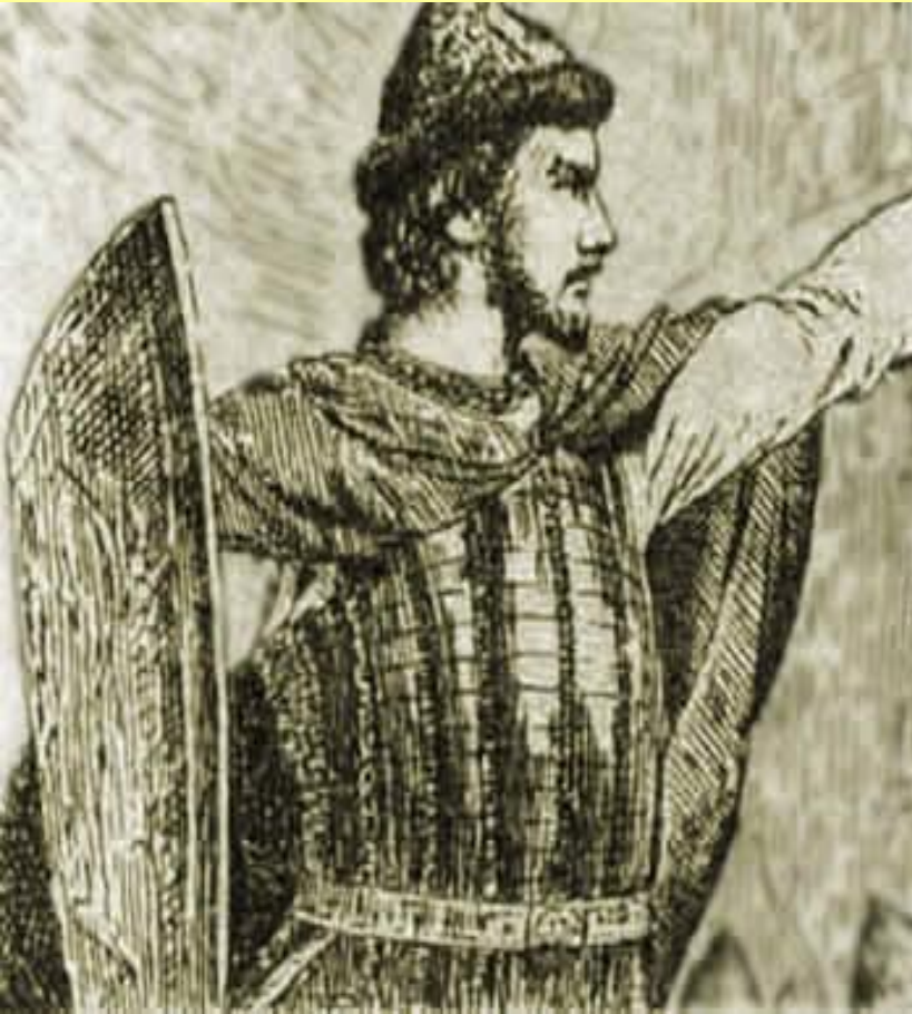
Великий князь Тверской Александр Михайлович

В 1329 г. Иван Калита осадил Псков, требуя выдачи тверского князя хану.