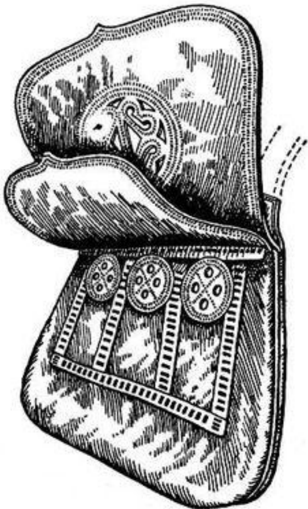
Сумка для денег – калита

После смерти Юрия московским князем стал его брат Иван Калита .