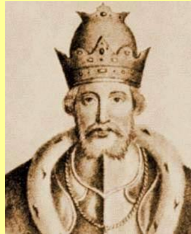
Юрий Данилович Московский

В 1304–1317 гг. ярлык находился в Твери.