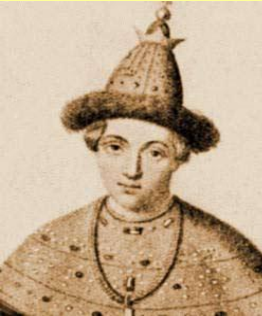
Великий князь Тверской Александр Михайлович

По словам летописи, Александр заявил псковичам: