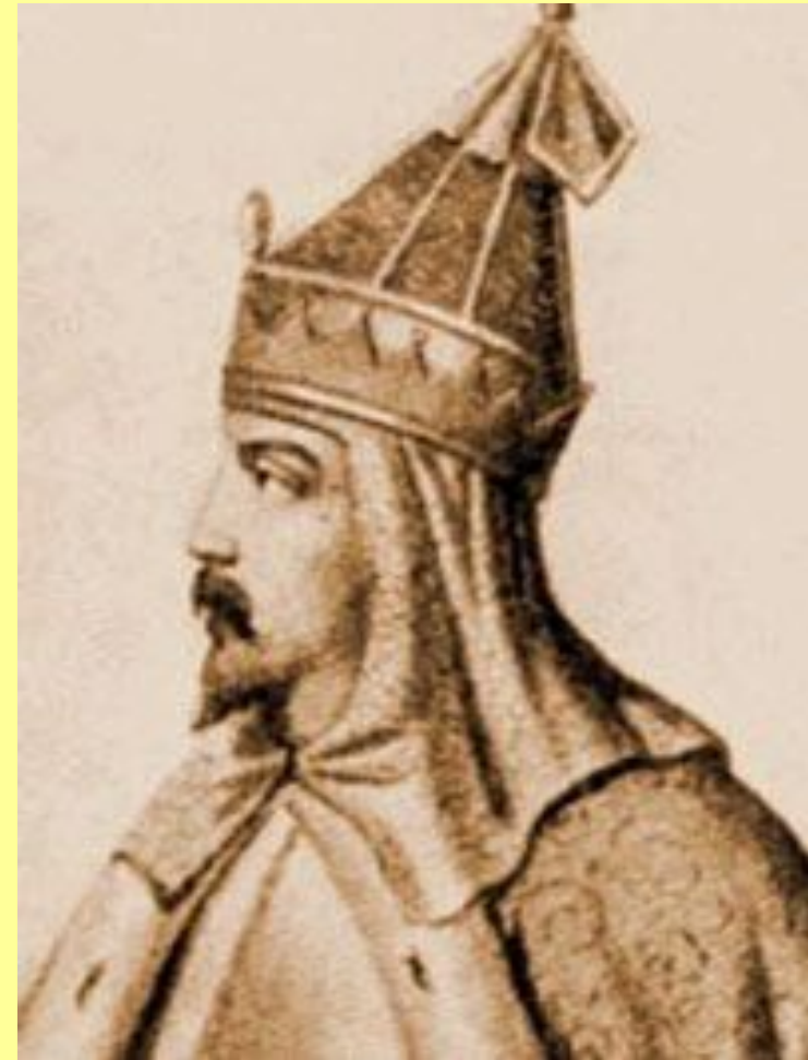
Иван Красный, великий князь Московский и Владимирский

Сравнительно слабый правитель: утратил контроль над Новгородом, допустил захват московской волости Лопасни рязанским князем, предпочел выкупить своего