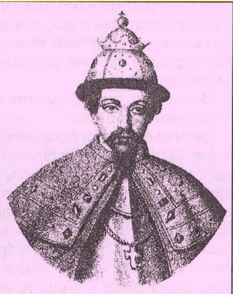
Симеон Гордый, Великий князь Московский и Владимирский

Старший сын Ивана Калиты, великий князь в 1340–1353 гг.