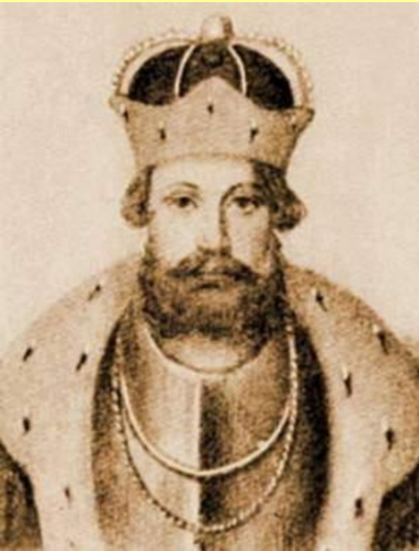
Михаил Ярославич Тверской

В 1304 г. умер великий князь Владимирский Андрей Александрович.