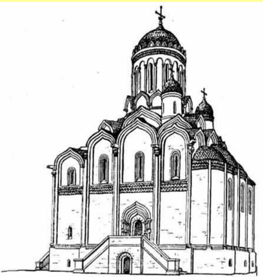
Успенский собор Московского Кремля времен Ивана Калиты