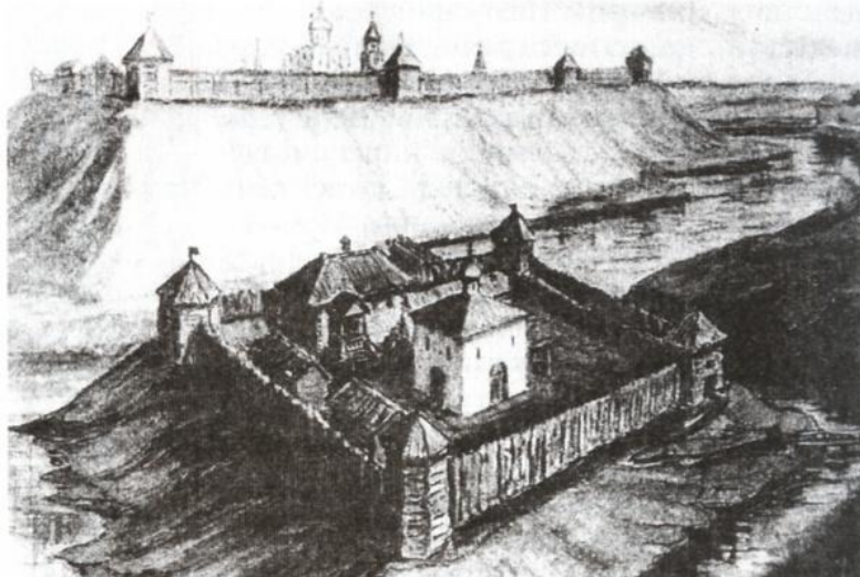
Укрепления Древней Твери