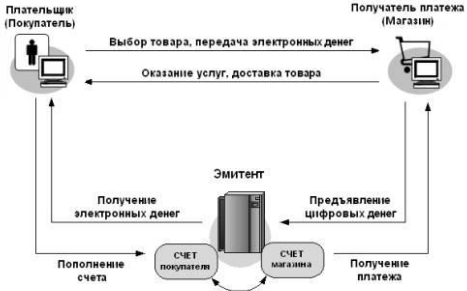
СХЕМА ПЛАТЕЖЕЙ С ПОМОЩЬЮ ЭЛЕКТРОННЫХ ДЕНЕГ