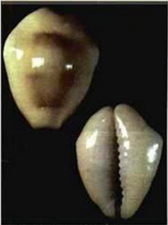
Раковины каури- первая мировая валюта

Закрепление за золотом роли всеобщего эквивалента