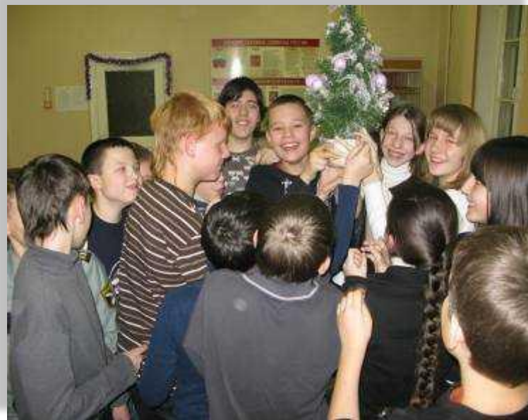
«Нам хорошо вместе»