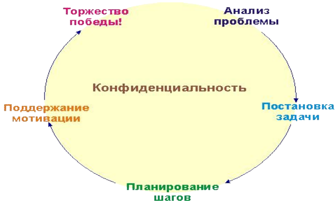
Схема работы коуча

Суть коучинга : умело оптимизировать человеческие ресурсы, которыми обладает компания, раскрытие потенциала каждого сотрудника