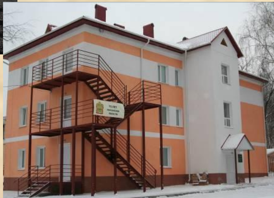
№ 5 «Дневной стационар»