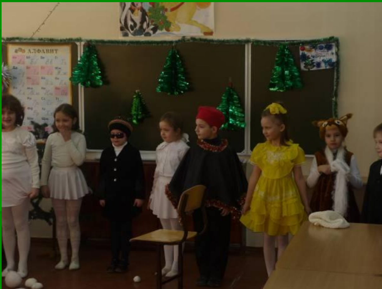
Новогоднее театрализованное представление