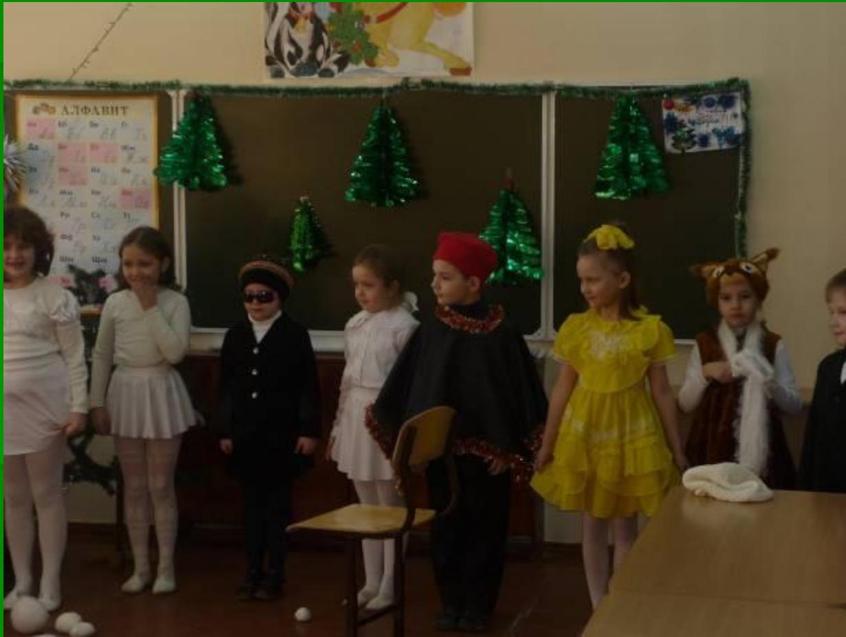
Новогоднее театрализованное представление