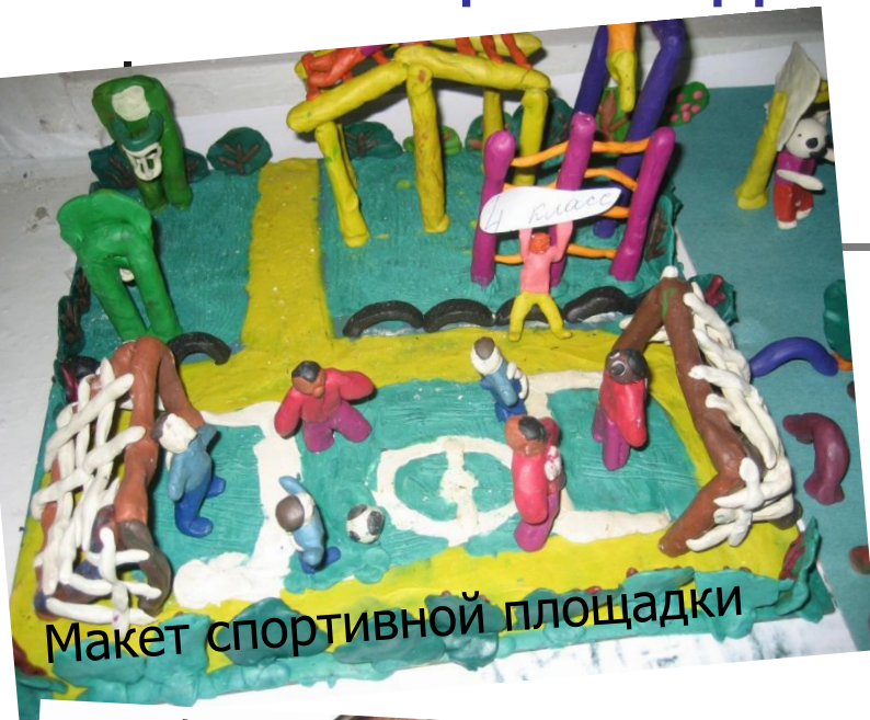
Макет спортивной площадки