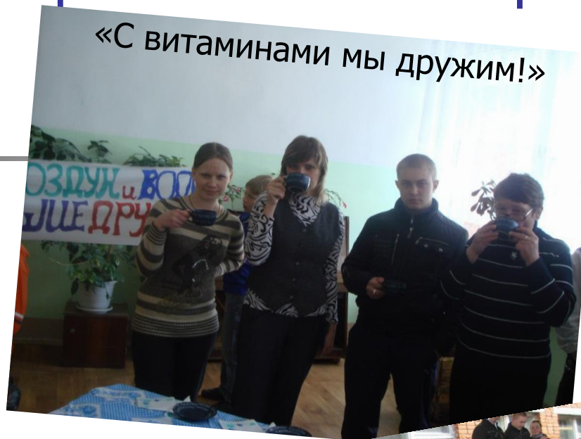
«С витаминами мы дружим!»