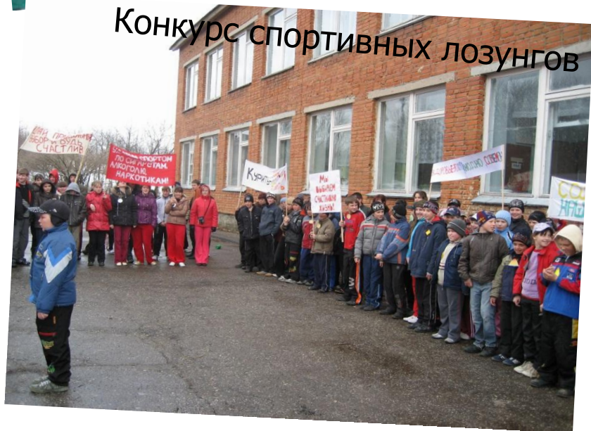
Конкурс спортивных лозунгов