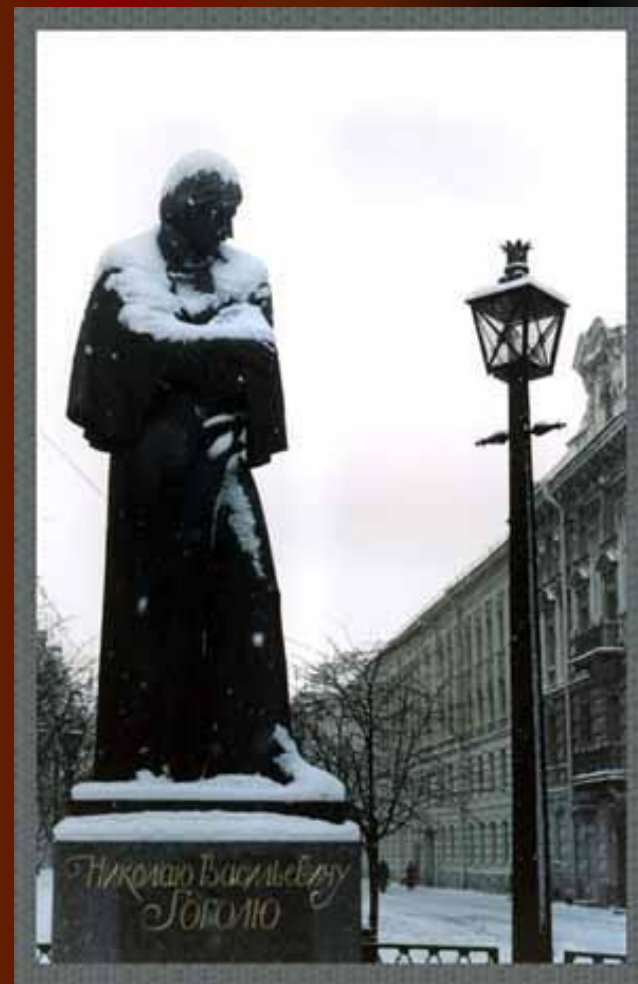
Памятник Н.В.Гоголю на Конюшенной