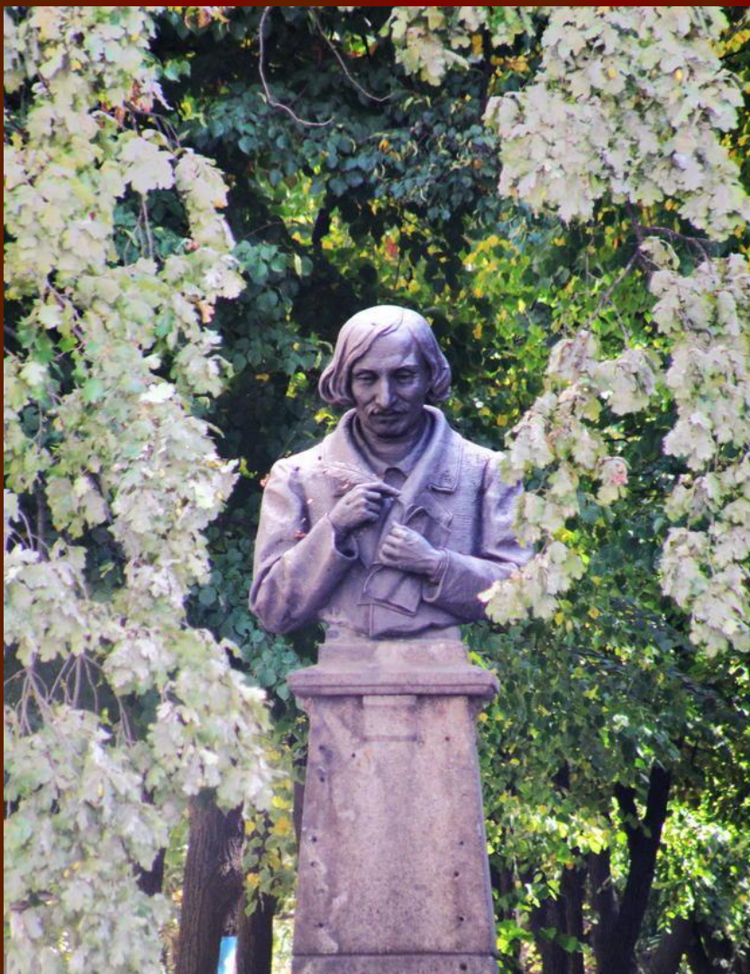
Памятник Н.В.Гоголю в Харькове