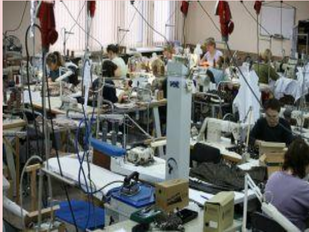
ЗАО «Чаплыгинская швейная фабрика»