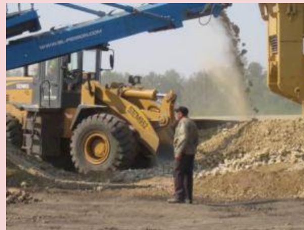
ООО «Дорстройкомплект» производство щебня