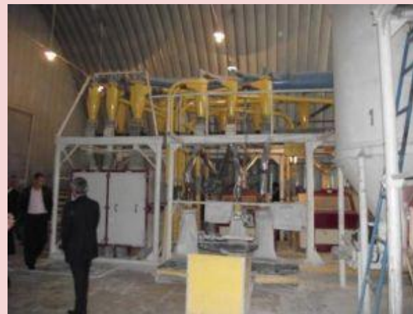
ООО «Липецкий мукомольный завод»