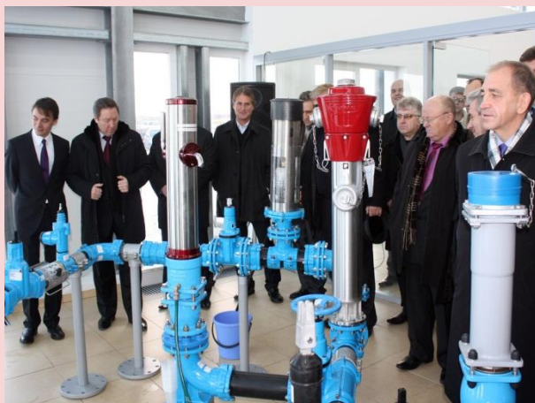
ООО «Хавле Индустриверке» производство водозапорной арматуры