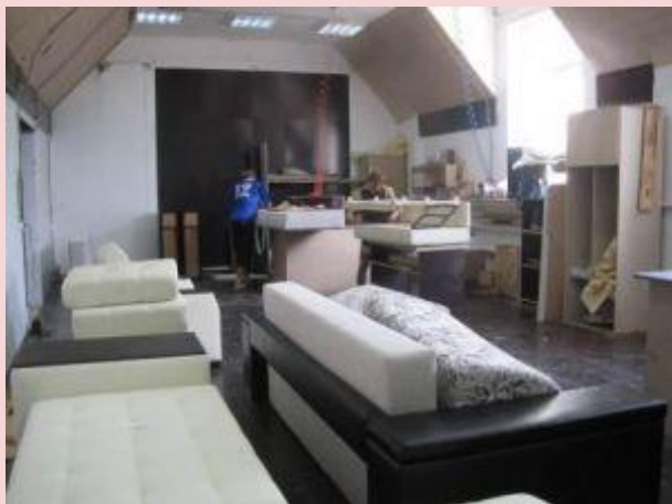
ИП Уткина А.Г. «Мир диванов»