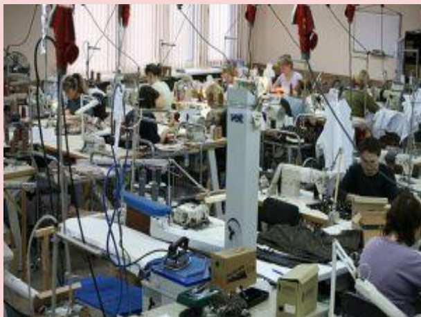
ЗАО «Чаплыгинская швейная фабрика»