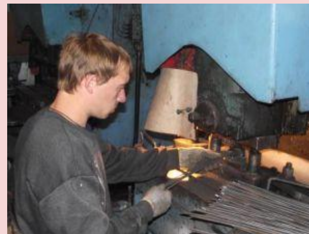
ИП Тарасов И.М. производство металлоизделий