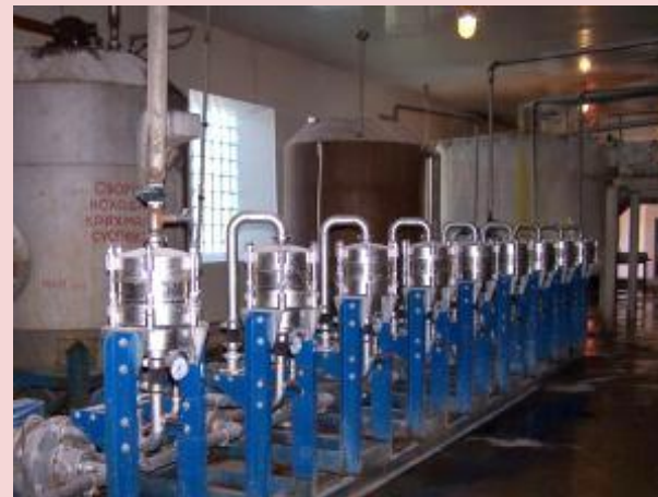
ООО «Чаплыгинский крахмальный завод»