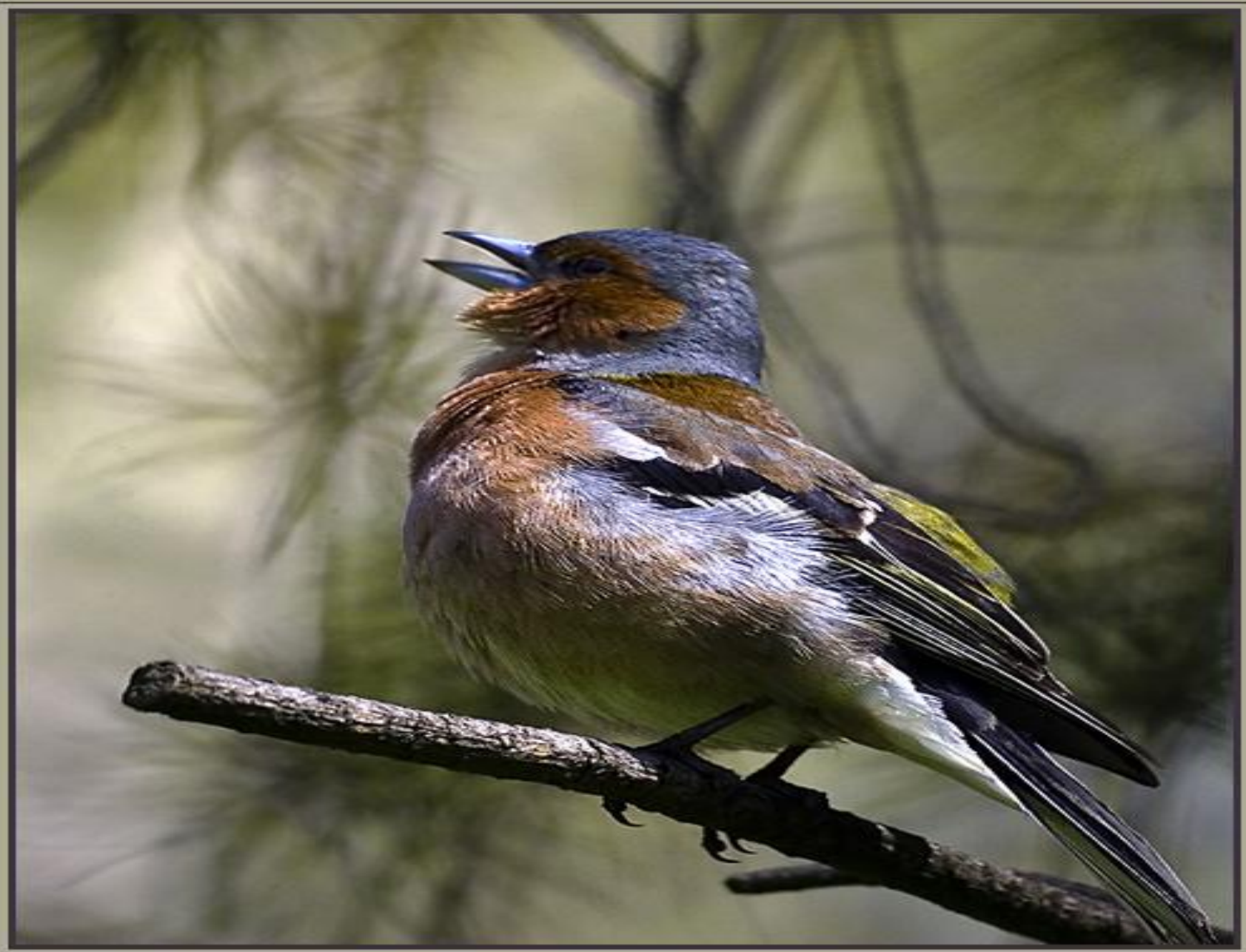
Зяблик ( Fringilla coelebs )