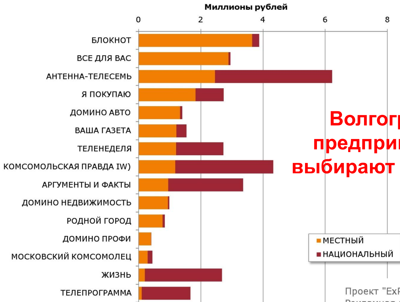
Распределение рекламных бюджетов среди изданий

Волгоградские предприниматели выбирают «Блокнот»!