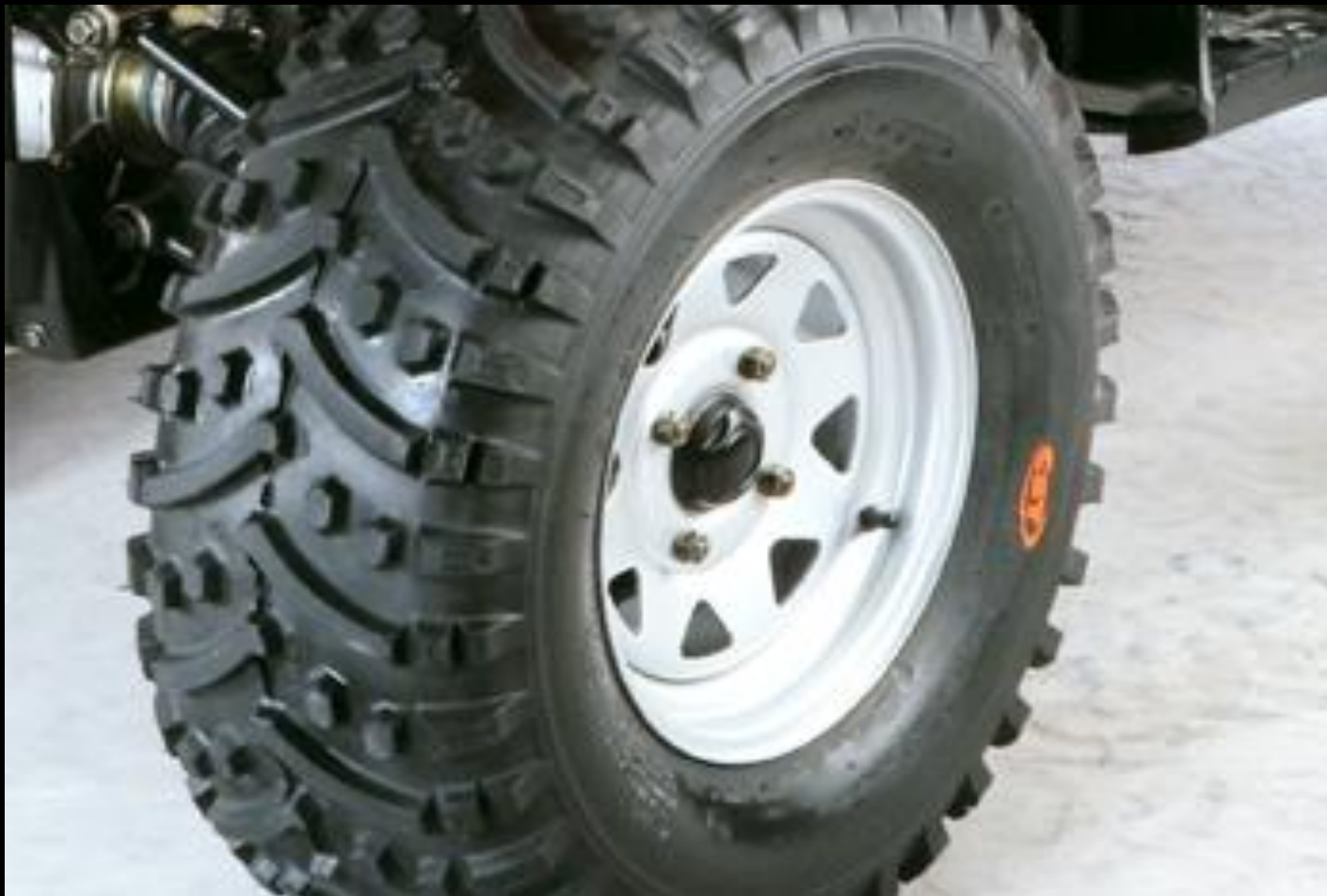
Бескамерные шины низкого давления с направленным протектором