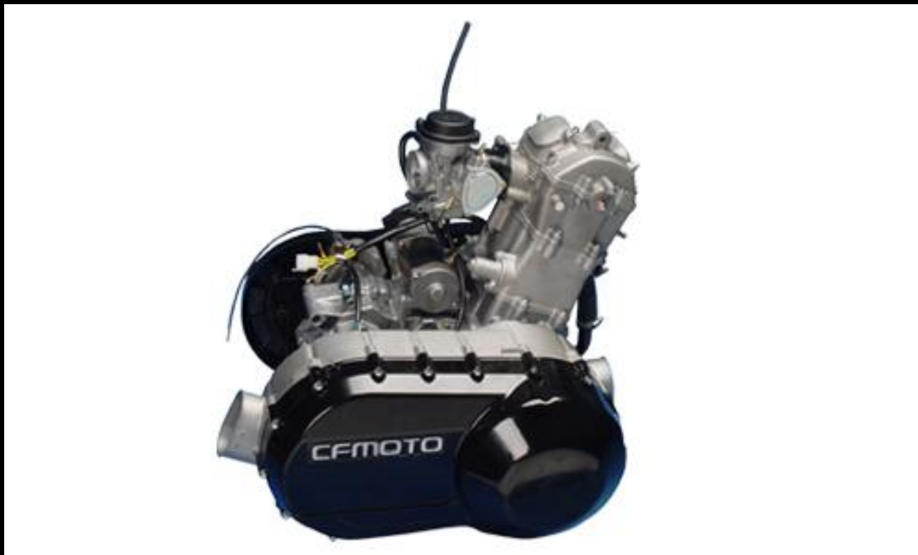
Четырехтактный двигатель 493 см 3 (SOHC) с жидкостным охлаждением