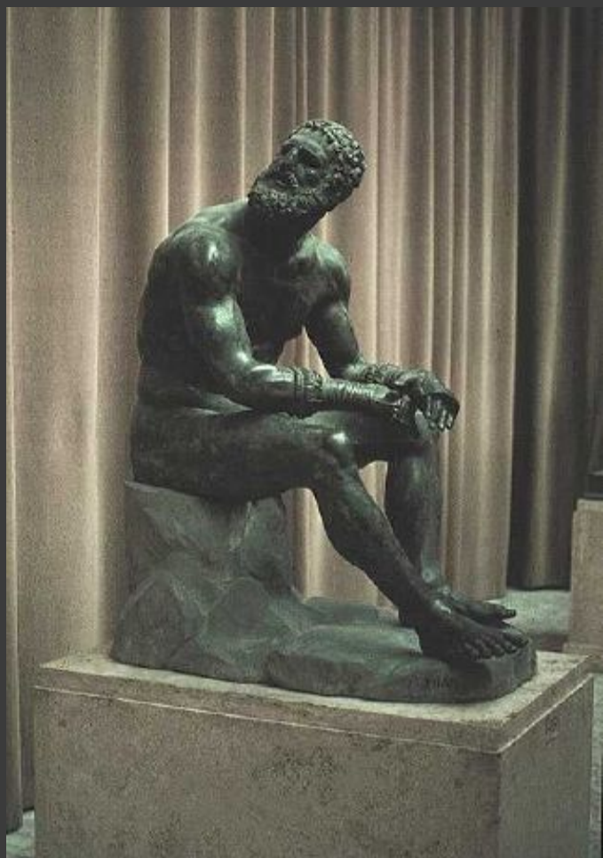
Бронзовая скульптура борца, победившего в Олимпийских играх.

В пятый заключительный день перед храмом Зевса ставили стол из золота и слоновой кости. На нём лежали награды.