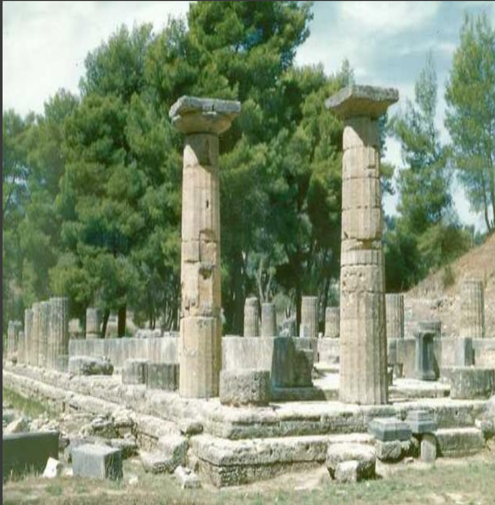
Олимпия. Место проведения Олимпийских игр.

В год Олимпийских игр глашатаи разносили по городам Эллады радостную весть: «Все – в Олимпию! Священный мир объявлен, дороги безопасны! Да победят сильнейшие!»