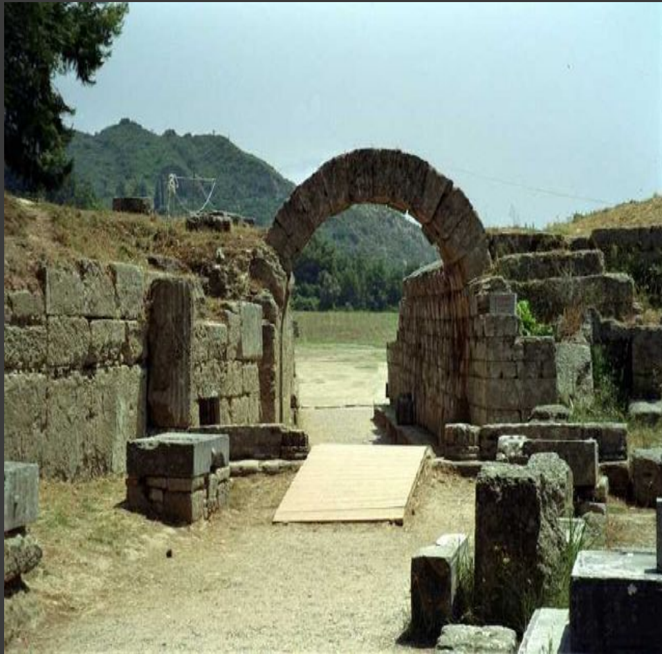
Вход на стадион в Олимпии.

Почти за год до начала Олимпийских игр все участники обязаны были приступить к тренировкам в своём родном городе. День за днём 10 месяцев подряд неустанно упражнялись атлеты. А ровно за месяц до открытия игр им надлежало прибыть в Южную Грецию и поблизости от Олимпии продолжить подготовку.